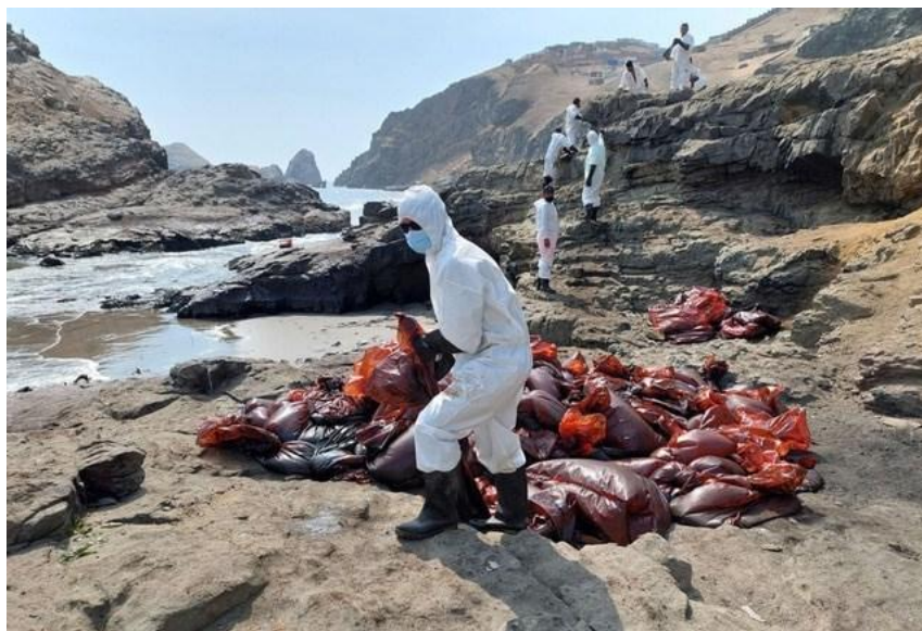
Nhân viên vệ sinh thu gom dầu vào các túi nhựa màu đỏ.

Chính phủ Peru đã ban hành lệnh khẩn cấp trong 90 ngày và cử các đội vệ sinh gồm hàng nghìn người cùng xe tải, máy hút dầu, rào chắn... để dọn dẹp ô nhiễm.