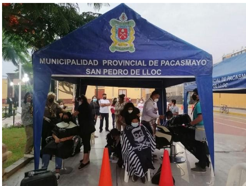
Người dân Peru tình nguyện cắt tóc để làm hàng rào thấm dầu.

Rất nhiều phụ nữ và cả đàn ông lẫn trẻ em đã hưởng ứng lời kêu gọi cắt tóc để làm vật liệu... tạo ra hàng rào thấm dầu.