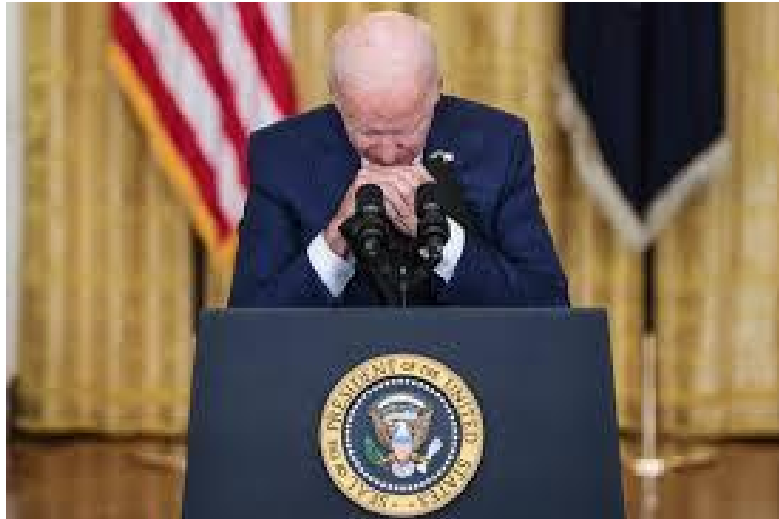
Nhà lãnh đạo oai phong đầy dũng khí của một đại cường!