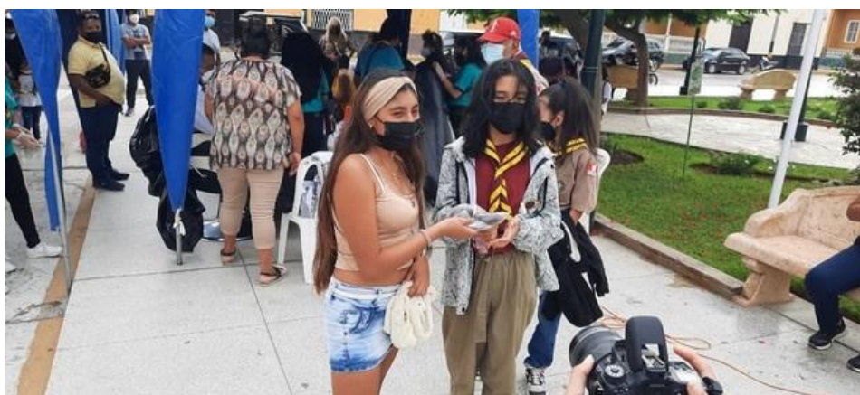
Hai cô gái Peru khoe tóc trước ống kính sau khi cắt mái tóc dài.

Ông nói thêm: “Nhiều địa phương ở Peru đã hỗ trợ chúng tôi. Mục tiêu là thu gom càng nhiều tóc càng tốt để tạo thành các búi tóc hình trụ nhồi vào trong tấm lưới. Chúng sẽ có tác dụng trong việc hấp thụ dầu tràn ra biển”.