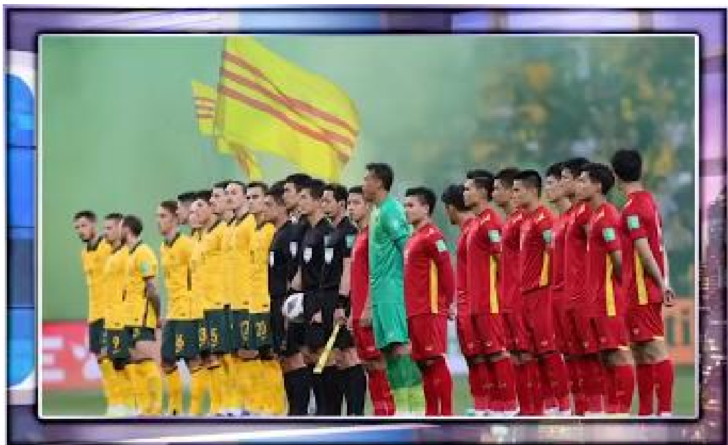
Trận đấu bóng đá một chiều giữa Australia (4) & Việt Nam (0)