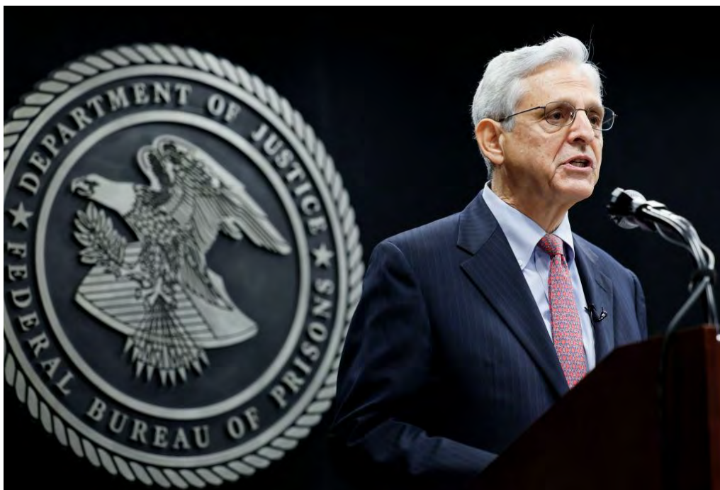
Bộ trưởng Tư Pháp Merrick Garland

“Tôi đã thủ sẵn đạn dược” – một người tweet. Một người khác ghi: “Nội chiến! Cầm súng lên đi mọi người (“Civil war! Pick up arms, people!”). Những kênh Telegram phổ biến của thành phần cực hữu tràn ngập lời kêu gọi “lock and load” (sẵn sàng lên đạn) cho cuộc nội chiến chống lại những gì họ cho là một chính phủ liên bang chuyên chế lật đổ Hiến pháp và “bắt bớ” một “nhà lãnh đạo yêu nước”.