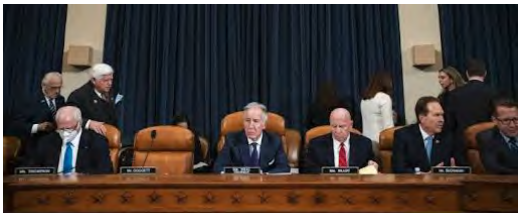
Rep. Richard Neal, chairman of the House Ways and Means Committee, center, and Rep. Kevin Brady, the committee's ranking member, third from right, during a business meeting in Washington, Dec. 20, 2022.

Câu hỏi lộ liễu: sao không dựa trên giấy khai thuế đã có sẵn của Bush con hay Obama hay Biden, mà lại nhất định phải là giấy thuế của Trump mới làm luật được? Dù sao thì đây cũng là lý do chính đáng mà TCPV đành chấp nhận, bắt ông Trump phải nộp 6 năm giấy khai thuế cho ủy ban. Tuy nhiên có điều kiện rõ ràng là không được công khai hóa những giấy thuế đó.