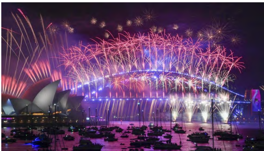
Pháo hoa từ Nhà hát lớn Sydney và cầu Harbour ở Sydney, Úc, ngày 01/01/2023.

Thế giới tung bừng đón năm mới trong bối cảnh nỗi sợ Covid hầu như biến mất.