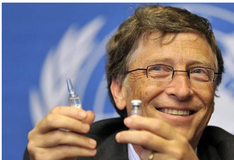
Vaccine gắn liền với cái bóng của Bill Gates.

Bill Gates cũng dành nhiều năm tham gia vào quá trình sản xuất các loại vaccine, bao gồm kiểm soát chất lượng và đánh giá lâm sàng. Sự hiểu biết này cho phép Gates tư vấn các chương trình phát triển vaccine và nghiên cứu tài trợ cho các lĩnh vực đổi mới. Trong hầu hết các trường hợp hoạt động của Gates, ông ta đều vượt khỏi phạm vi giám sát và trách nhiệm quốc gia.