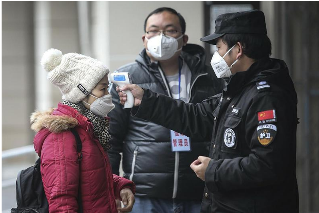
Các quốc gia đang khóc thét vì một “giải pháp cho cuộc khủng hoảng đang ngày càng lớn do COVID-19. (Ảnh qua Twitter)

Chúng ta cùng nhìn lại diễn biến sự bùng phát của đại dịch Vũ Hán: Theo truyền thông chính thức, virus corona thật bắt nguồn từ dơi trong 1 khu chợ rồi được truyền sang người và biểu hiện các triệu chứng nhẹ. Vaccine cũng cần tới 12-18 tháng để được phát triển.