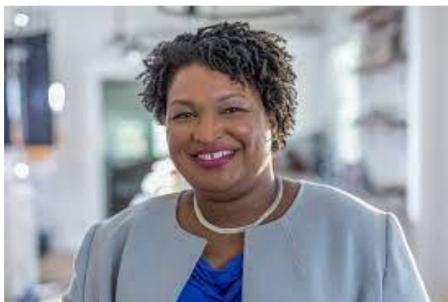
Bà Stacey Abrams

Phe DC la toáng lên, cho đó là biện pháp kỳ thị, nhằm cản dân da đen đi bầu. Bà Stacey Abrams, ứng cử viên thống đốc của đảng DC, đã khởi kiện, đòi hủy bỏ hết mọi hình thức kiểm soát cử tri, để cử tri tự do, thoải mái đi bầu, giúp cho đảng DC tha hồ gian lận phiếu.