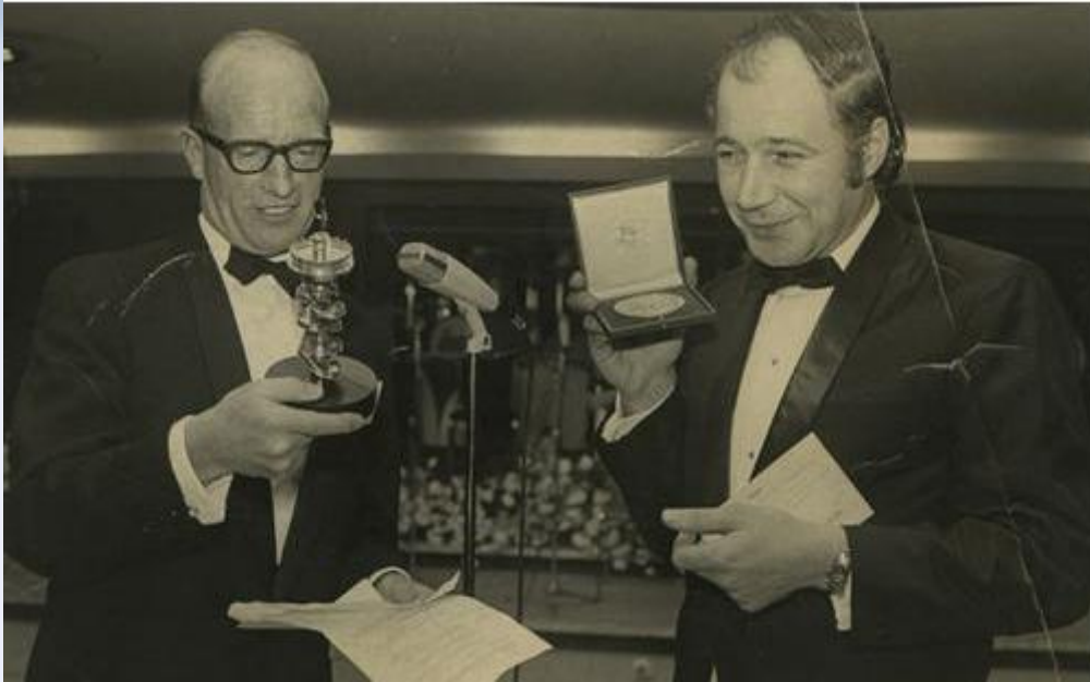
Eddie Adams cầm chiếc cúp trong lễ trao giải Pulitzer

Eddie đã viết những dòng rất cảm động xin lỗi tướng Loan vào dịp tang lễ viên tướng này: “Hai người đã chết trong tấm hình đó: người bị bắn và tướng Loan. Viên tướng giết người việt cộng, tôi thì giết viên tướng. Tôi giết ông bằng máy chụp hình. Hình chụp là vũ khí mạnh nhất thế giới. Người ta tin chúng, nhưng chúng lại nói dối ngay cả khi người chụp thật lòng: chúng chỉ cho thấy nửa sự thật!”