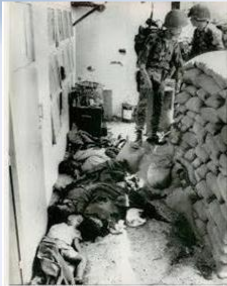
(NY10-Feb 1, 1968) - South Vietnamese soldiers stand near bodies of a South Vietnamese commander of a training camp and command center and members of his family after the camp was retaken from the Viet Cong. The commander, a colonel, was decapitated and his wife and six children were machine gunned.