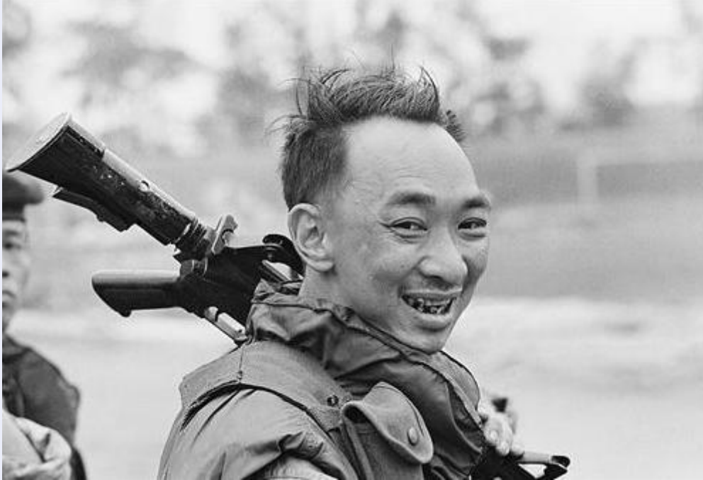
Tướng Nguyễn Ngọc Loan Chỉ huy trưởng Cảnh Sát QG Nam VN