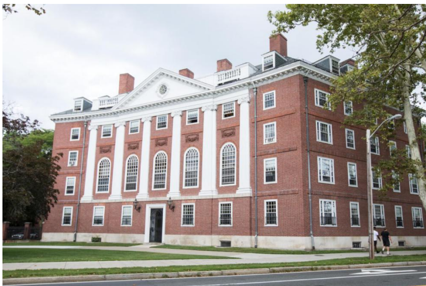
Một tòa nhà của Đại học Harvard ở Cambridge, Massachusetts vào ngày 30 tháng 8 năm 2018.