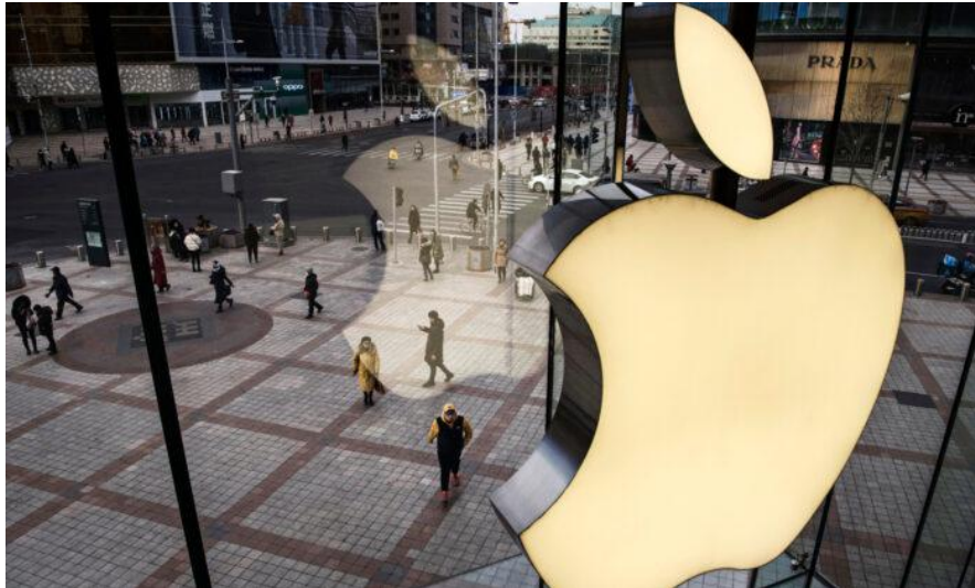
Logo của Apple trên cửa sổ tại một cửa hàng Apple ở Bắc Kinh, Trung Quốc, vào ngày 7 tháng 1, 2019.

Thượng nghị sĩ Josh Hawley (R-Mo.) trên Twitter vào ngày 21 tháng 10 đã chỉ trích Cook vì quyết định làm chủ tịch hội đồng quản trị.