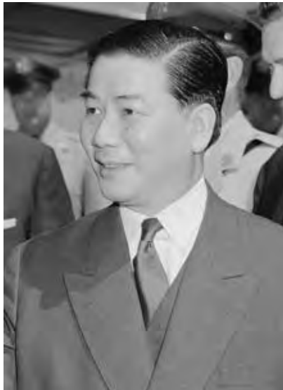
TT Ngô Đình Diệm in 1957