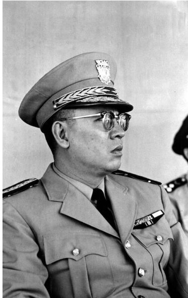
Tr. T Trần thiện Khiêm