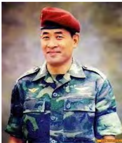
Đại Tướng Cao văn Viên

Từ đơn vị tác chiến (tiểu đoàn 41 BĐQ), tôi được lệnh về làm Sĩ quan Tùy Viên cho Đại Tướng Cao văn Viên, Tổng Tham Mưu Trưởng vào cuối năm 1966. Vì tôi không có nhà ở Sài Gòn nên ông bà Đại Tướng cho tôi tạm ở trong tư dinh thời gian đầu .