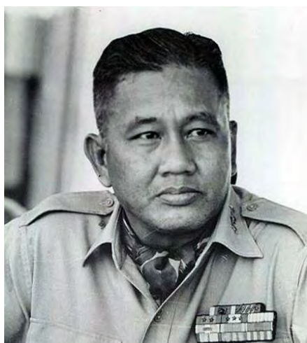
Tr. T Dương Văn Minh