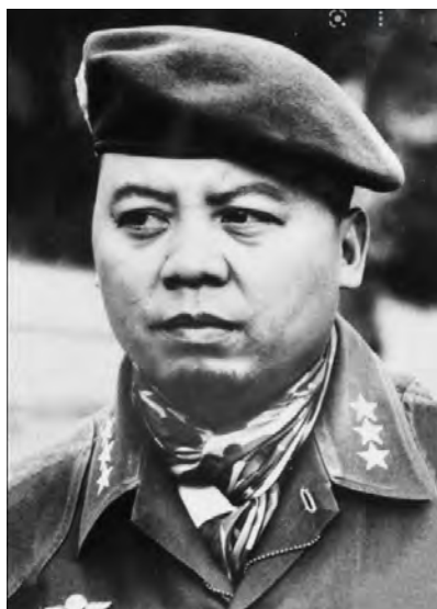
Tr. T Nguyễn Khánh