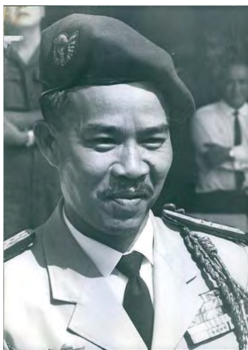
Tr. T Nguyễn chánh Thi

“Về sau mới biết, sở dĩ ông Khiêm hành động như vậy vì ngày 5-11-1963, ông Minh nói với ông Khiêm rằng đại tá Nguyễn chánh Thi ở Campuchia sắp về, ông Minh sẽ cho ông Thi chỉ huy lại Lực Lượng Nhảy Dù, điều này chính ông Khiêm không muốn, nên hành động trước một bước, vì nếu để ông Nguyễn chánh Thi chỉ huy nhảy dù thì khi ông Khiêm muốn mưu đồ gì cũng không thể xử dụng lực lượng nhảy dù được vì ông Khiêm với ông Thi không thân nhau, vả lại cũng còn ngờ vực không biết ông Thi còn ôm mối hận ngày 11-11-1960 cách 3 năm trước hay không.