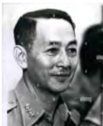
Tr. T Lê văn Kim

“Đến khi ông Khiêm trở về thì ông Minh chỉ định ông Khiêm làm tư Lệnh Quân Đoàn III chia bớt nhiệm vụ của Trung tướng Đính đang kiêm nhiệm Bộ An Ninh. Thời gian này Quân Đoàn III còn nằm trong trại Lê văn Duyệt Sài Gòn chưa dời lên Biên Hoà. Vậy là ông Khiêm bị hạ tâng công tác nên ông Khiêm trở nên bất mãn.”