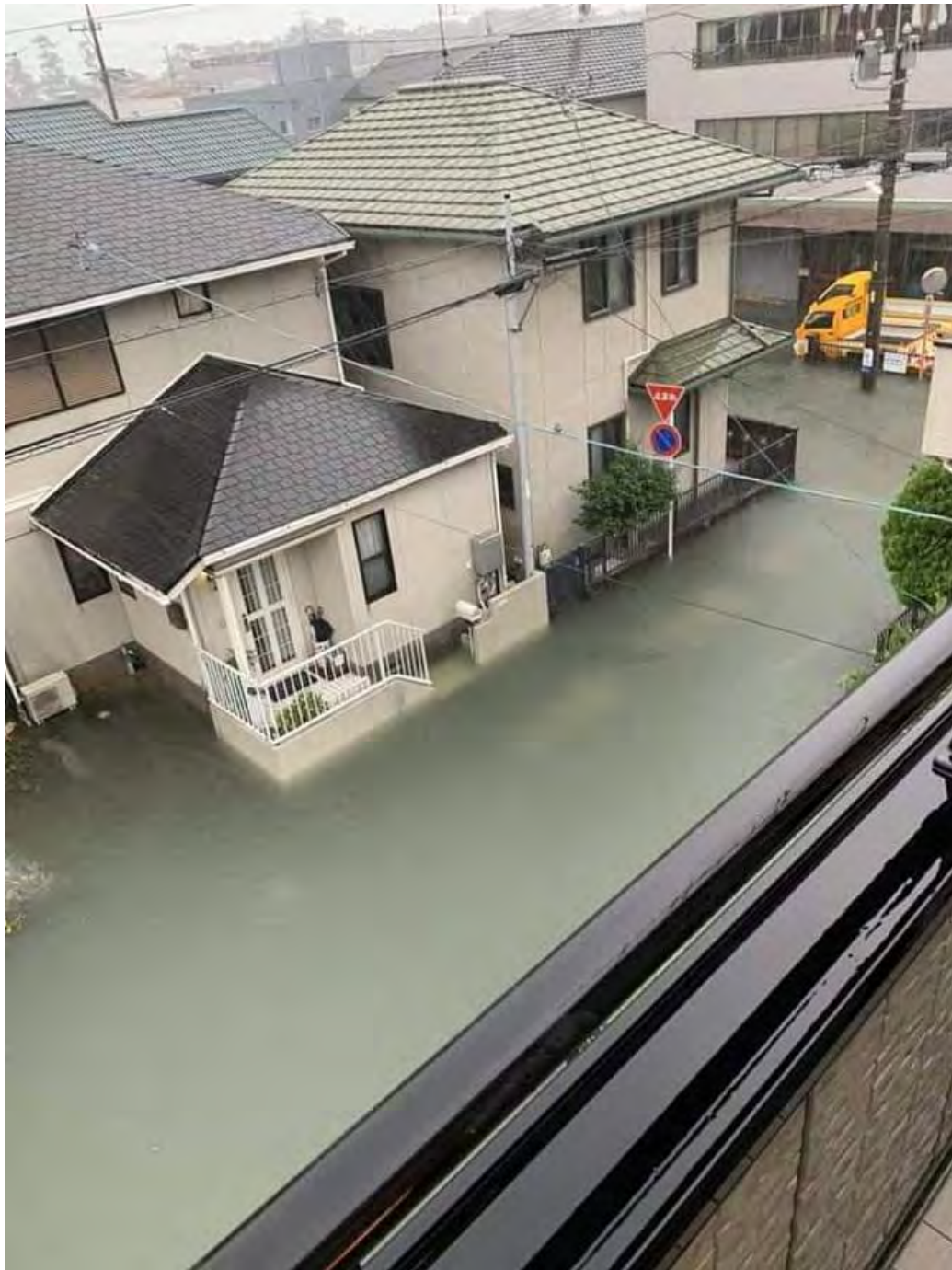
Hình ảnh những ngôi nhà chìm trong nước lũ nhưng xung quanh không một tí rác được chia sẻ rầm rộ trên Twitter