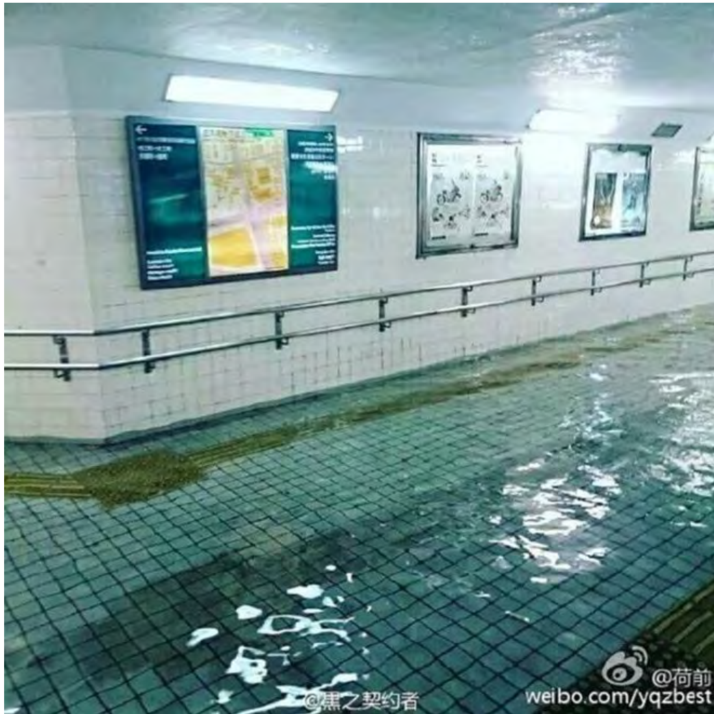
Nước cảnh nước lũ trong veo một cách đáng ngạc nhiên, trông không khác gì bể bơi ở Nhật.