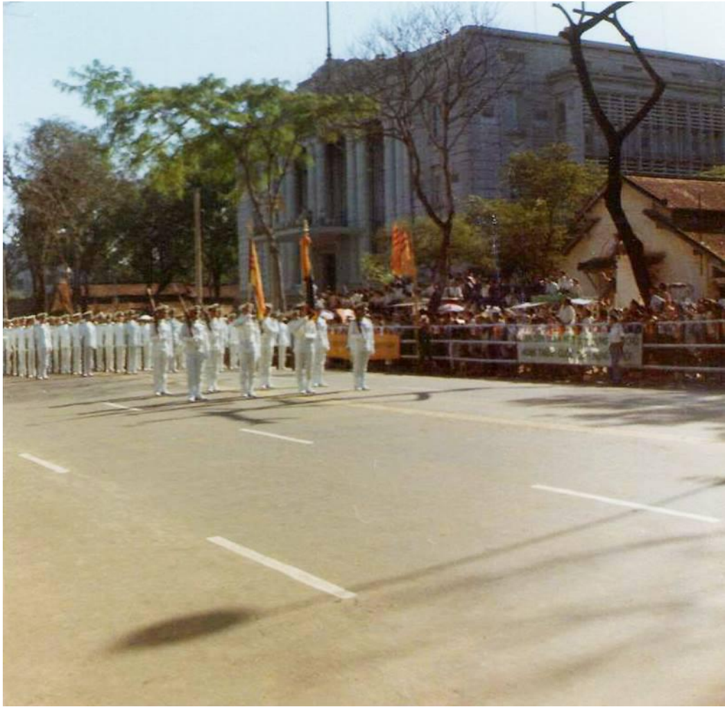
Diễn binh QK 1/11/1967. Trên Đại lộ Thống Nhất trước công ty xăng SHELL. Vietnam Nov 67 Parade.