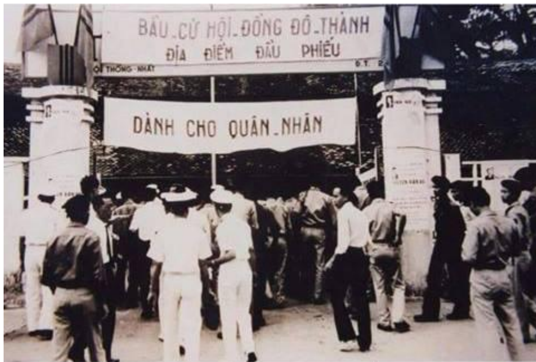
Cổng Trường Trung Học VHQĐ, 17 Thống Nhất, Sài Gòn ngày bầu cử.