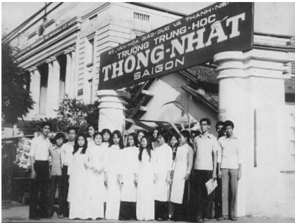
Trường Trung học Thống Nhất của Bộ VHGD và TN (Có lẽ là vào năm 1970-75)