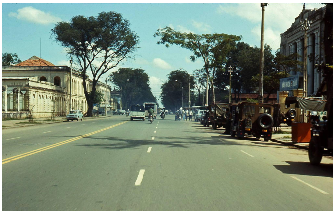
Saigon 1970. Đại lộ Thống Nhất. Bên phải hình là cổng trường Văn Hóa Quân Đội, nơi ngày nay là Khách sạn Sofitel Plaza và tòa nhà của Trung Tâm Lưu Trữ Quốc Gia.