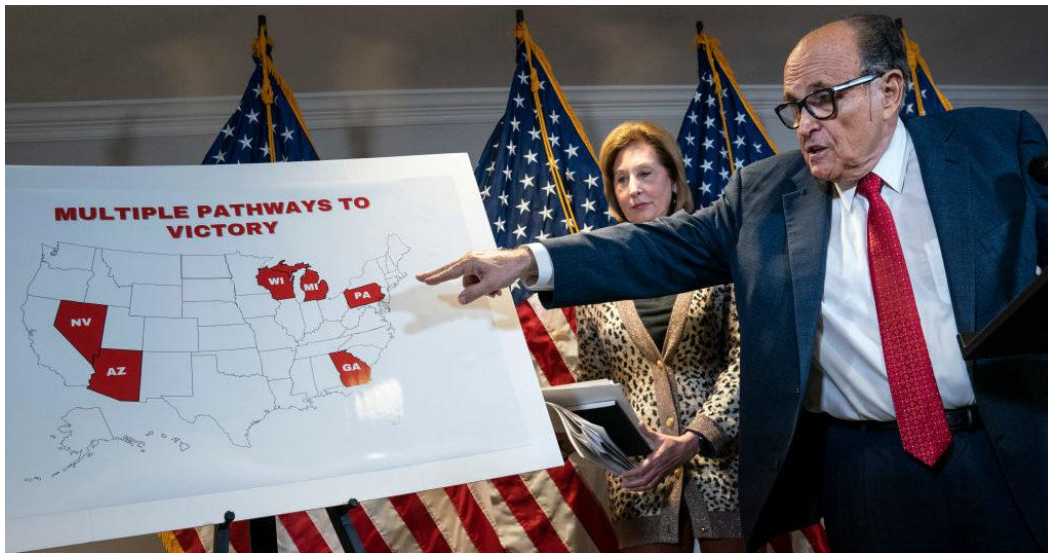
Luật sư Rudy Giuliani chỉ lên bản đồ vẽ con đường đến chiến thắng của Tổng thống Trump trong cuộc họp báo ngày 19/11/2020