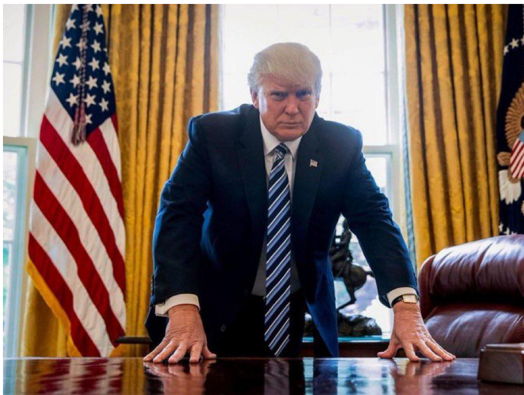
Tổng thống Mỹ Donald Trump.

Tổng thống Donald Trump tuyên bố, ứng cử viên đảng Dân chủ Joe Biden chỉ có thể vào Nhà Trắng nếu ông ta có thể chứng minh số phiếu bầu không phải là “gian lận hoặc bất hợp pháp”.