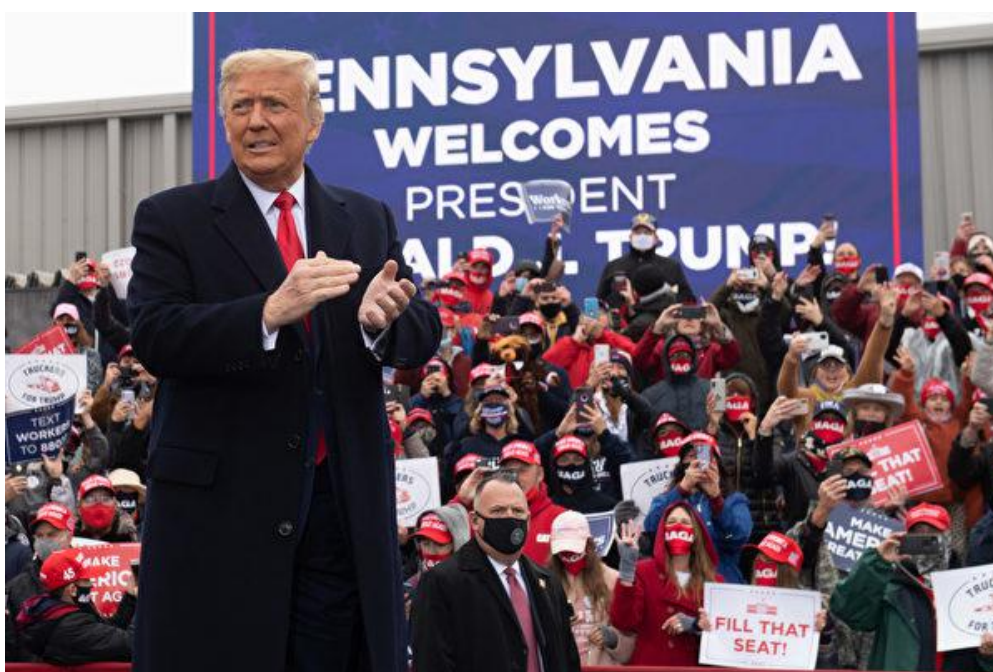
Tổng thống Trump vận động bầu cử ở bang Pennsylvania.

“Báo cáo: Dominion đã xóa 2,7 triệu phiếu bầu cho Trump trên toàn quốc. Phân tích dữ liệu cho thấy 221.000 phiếu ở Pennsylvania cho Tổng thống Trump đã bị chuyển sang cho ông Biden. 941.000 phiếu cho Trump bị xóa. Những bang sử dụng hệ thống bỏ phiếu Dominion chuyển 435.000 phiếu từ Trump sang cho Biden”, ông Trump dẫn nguồn tin của Chanel Rion, hãng tin OANN.