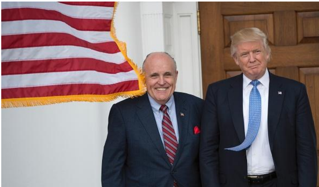
Ông Giuliani - luật sư riêng của ông Trump (trái) và Tổng thống Trump (phải).

“Dường như nó thuộc về một công ty của Canada; thực sự nó là công ty do hai người Venezuela sở hữu và đã hoạt động kinh doanh được 20 năm và nó đã bị loại ra ở nhiều nơi”, ông Giuliani nói.