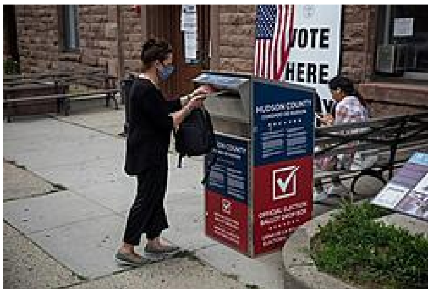
Một cử tri bỏ phiếu bầu tại một thùng thư ở Hoboken.

“Tôi chỉ cần đặt [phiếu bầu] qua máy sao chép và nó sẽ ra theo đúng y chang [bản chính],” người trong cuộc nói.