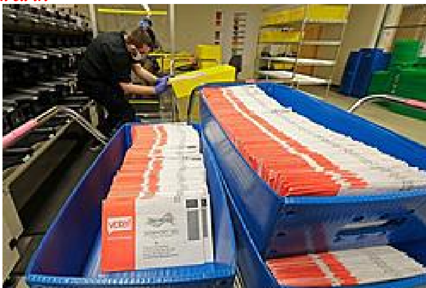
Các phiếu bầu cử qua thư được bày trong các khay phân loại tại trụ sở Cơ quan Bầu cử Quận King ở Renton, Wash., Phía nam Seattle, ngày 5/8/2020.

Khi tất cả những cách trên đều thất bại, người trong cuộc sẽ cử các ‘đám tay chân’ đi bỏ phiếu trực tiếp tại các điểm bỏ phiếu, đặc biệt là ở các bang như New Jersey và