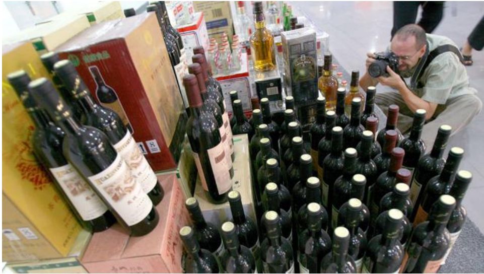
Tang vật rượu giả thu được tại nhà Rudy.

Sau vụ vận chuyển lô rượu vang giả danh nhà Ponsot đổ bể, Rudy ngày càng bị nghi ngờ. Đỉnh điểm của vụ việc là tháng 2-2012, nhà sản xuất Spectrum Wine Auctions phát hiện một lô rượu vang trị giá 785.000 USD của Rudy trong một cuộc bán đấu giá.