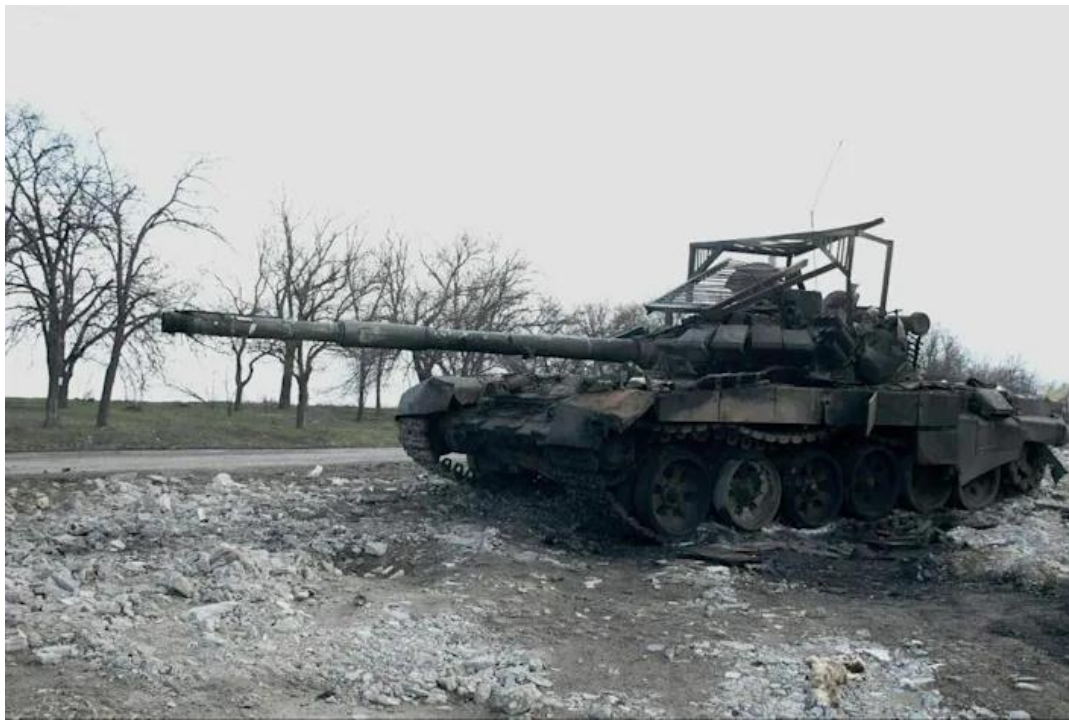
Một chiếc xe tăng của Nga nằm trên đường phố Kherson, Ukraine.

Một đơn vị máy bay không người lái tinh nhuệ của Ukraine khai thác màn đêm để tiêu diệt xe tăng và xe tải của Nga trong khi binh sĩ của họ đang ngủ Andy Van (theo Alia Shoaib - Business Insider)