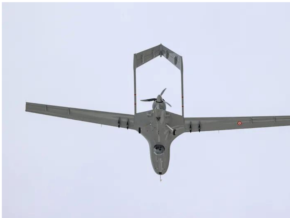
Một máy bay không người lái Bayraktar TB2.

Theo tờ báo, kho vũ khí máy bay không người lái của đơn vị bao gồm từ loại thương mại giá rẻ cho đến máy bay không người lái hạng nặng đã được sửa đổi để thả lựu đạn chống tăng và quan sát bằng camera nhiệt.