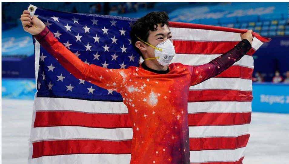
Vận động viên Nathan Chen, người đã giúp Mỹ về nhất ở môn trượt băng nghệ thuật nam.

Trong bối cảnh căng thẳng ngoại giao giữa Mỹ và Trung Cộng leo thang, phát ngôn này đã khiến anh bị "tấn công". Chen bị gọi là "kẻ phản bội" và bị buộc tội "xúc phạm Trung Cộng".