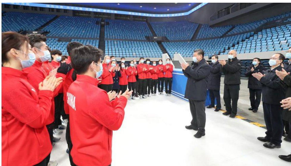
Chủ tịch Trung Cộng Tập Cận Bình nói chuyện với các vận động viên và huấn luyện viên khi đến thăm Nhà thi đấu Thủ đô ở Bắc Kinh.

Theo CNN, các vận động viên trẻ đã bị kéo vào "vòng xoáy" khi mối quan hệ Mỹ - Trung đang xấu đi, tại một trong những Thế vận hội Olympic đầy rẫy vấn đề chính trị và được kiểm soát chặt chẽ nhất trong lịch sử.