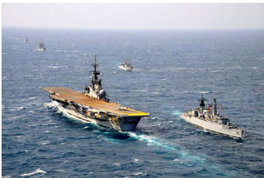
A handout picture of Brazilian aircraft carrier Sao Paulo

(AFP) – Hàng không mẫu hạm Pháp Foch bị nhận chìm trong lòng Đại Tây Dương. Nhiều tổ chức bảo vệ môi trường hôm 02/02/2023 mạnh mẽ phản đối Brazil quyết định nhận chìm hàng không mẫu hạm Foch mua lại của Pháp từ hồi năm 2000. Từng là một niềm tự hào của Hải Quân Pháp, tàu sân bay Foch, được chuyển nhượng lại cho Brasilia, đã được kéo tới một địa điểm cách bờ 350 cây số, và sẽ ngủ vùi trong lòng đại dương ở độ sâu 5.000 mét. Trong 37 năm hàng không mẫu hạm Foch phục vụ trong Hải Quân Pháp trước khi được chuyển nhượng lại cho Brazil và được đổi tên thành hàng không mẫu hạm Sao Paulo.