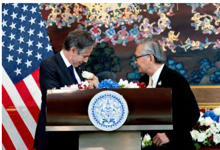
Ngoại trưởng Thái Lan Don Pramudwinai (phải) cài hoa lên áo khoác của Ngoại trưởng Hoa Kỳ Antony Blinken sau khi nói chuyện với báo giới sau lễ ký Biên bản Ghi nhớ (MOU) tại Bộ Ngoại giao Thái Lan ở Bangkok, Thái Lan, hôm 10/07/2022.

Nói cách khác, Trung Quốc có quyền kiểm soát đáng kể đối với mọi khía cạnh của xã hội Thái Lan. Ảnh hưởng của ĐCSTQ đối với Thái Lan, một đồng minh chủ chốt của Hoa Kỳ, không phải là bị cường điệu hóa quá mức. Bangkok, quốc gia lớn tiếng ủng hộ chính sách “Một Trung Quốc”, thường xuyên tổ chức các cuộc tập trận quân sự chung với Bắc Kinh.