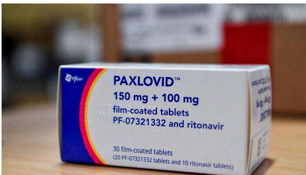
Ảnh minh họa: Một hộp thuốc trị Covid của hãng Pfizer.

Covid-19: Trung Quốc muốn sản xuất thuốc của Pfizer và vac-xin ARN nội địa.