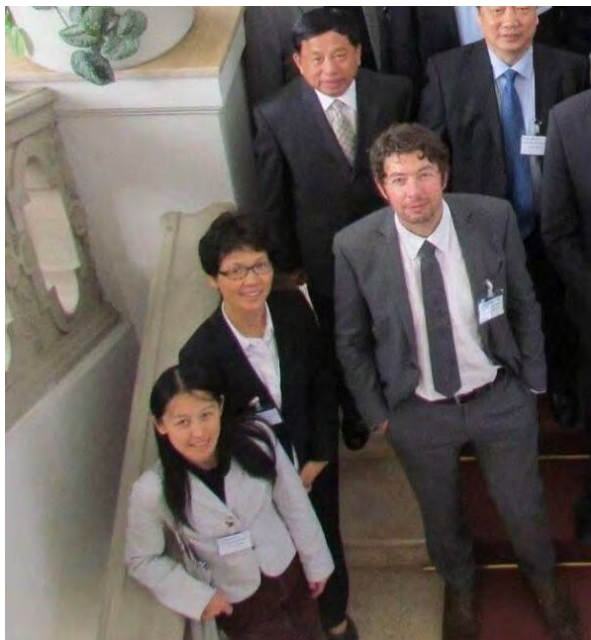
Ông Christian Drosten tại sự kiện của Cao đẳng Y khoa Đồng Tế?

“Thật là trùng hợp,” một số bài đăng lưu ý một cách mỉa mai (xem ví dụ tại đây ). Nhiều bài viết liên kết đến một trang web của Charité. Nhưng liên kết này không chứa bất kỳ bức ảnh nào như vậy — hoặc không còn chứa nữa. Liên kết này chỉ dẫn đến thông tin chung chung về chương trình trao đổi giữa hai bệnh viện Charité và Đồng Tế, vì vậy nguồn gốc của bức ảnh này vẫn không rõ.