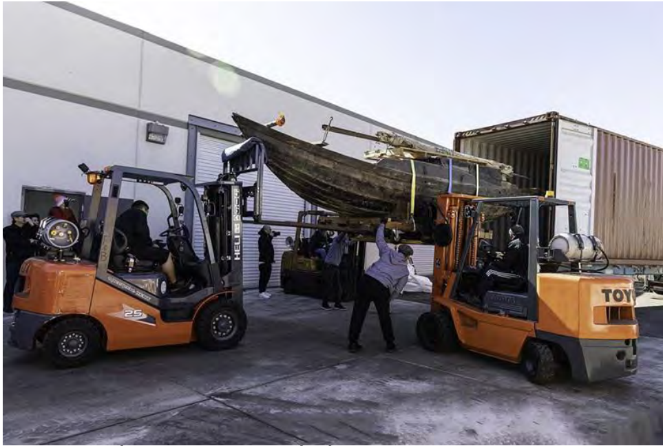
Chiếc Ghe Viễn Xứ đã về đến Little Saigon.