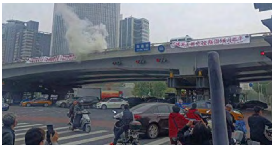
Sáng 13/10, hai biểu ngữ phản đối khổng lồ đã được treo trên cầu Tứ Thông trên đường vành đai 3 phía Bắc ở Bắc Kinh. (Ảnh chụp từ màn hình)

Trong một video từ hiện trường có thể nghe thấy tiếng một người đàn ông trên loa hô hào những câu phản đối ghi trong biểu ngữ.