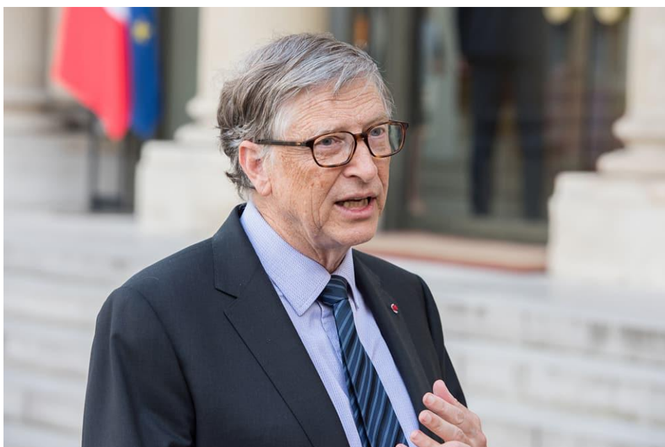
Tỷ phú Bill Gates

Cái giá phải trả cho những nhượng bộ này từ Quỹ Tiền tệ Quốc tế sẽ là việc từ bỏ tài sản tư nhân và tuân thủ chương trình tiêm phòng vắc-xin chống lại dịch COVID-19 và COVID-21 được thúc đẩy bởi Bill Gates với sự phối hợp của các Tập đoàn được phẩm lớn.