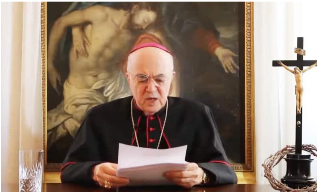
Đức Tổng giám mục Carlo Maria Vigano

Ngày 4/11, Đức Tổng Giám mục và là cựu Sứ Thần Tòa Thánh tại Hoa Kỳ Carlo Maria Vigano đã tuyên bố trong một bức thư ngỏ rằng quá trình bầu cử tổng thống Hợp chúng quốc Hoa Kỳ đã có gian lận, “giả mạo gây sốc ... luôn luôn chỉ chống phá Tổng thống Donald J. Trump, và luôn luôn chỉ ủng hộ ông Biden”. Ông kêu gọi các tín hữu Công giáo hãy lần Chuỗi Mân Côi cầu nguyện xin Đức Mẹ “ban chiến thắng cho lực lượng Thiện” mà đại biểu là Tổng thống Donald Trump. Dưới đây là bức thư ngỏ của ông.