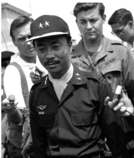
Thiếu Tướng Nguyễn Cao Kỳ

Bất cứ điều gì, chúng tôi tin chắc rằng, phải được quyết định sau bức màn siêu quyền lực. Người Mỹ, người Nga, người Tàu _ chúng tôi tin chắc là thế _ sẽ quyết định số phận của Việt Nam. Chúng tôi đã chờ đợi ngày này qua ngày khác mới thấy những điều họ đã âm mưu. Chúng tôi nghĩ một phần trong những âm mưu đó là người Mỹ sẽ ngưng cung cấp hàng tiếp liệu cho chúng tôi.