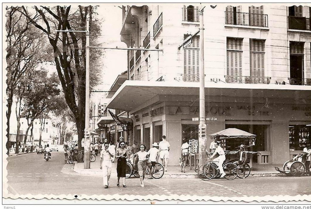
Quán cafe Cái Chèo

Những thị dân Saigon ngày xưa, hẳn ai cũng nhớ đến góc phố cũ khu Lê Thánh Tôn-Tự Do với quán cà phê Cái Chèo (La Pagode). Xích xuống phía dưới, trước nhà Hạ Nghị Viện, đối diện với khách sạn Continental là cà phê Givral... và rạp ciné Eden, bên kia đường Nguyễn Huệ là ciné Rex.