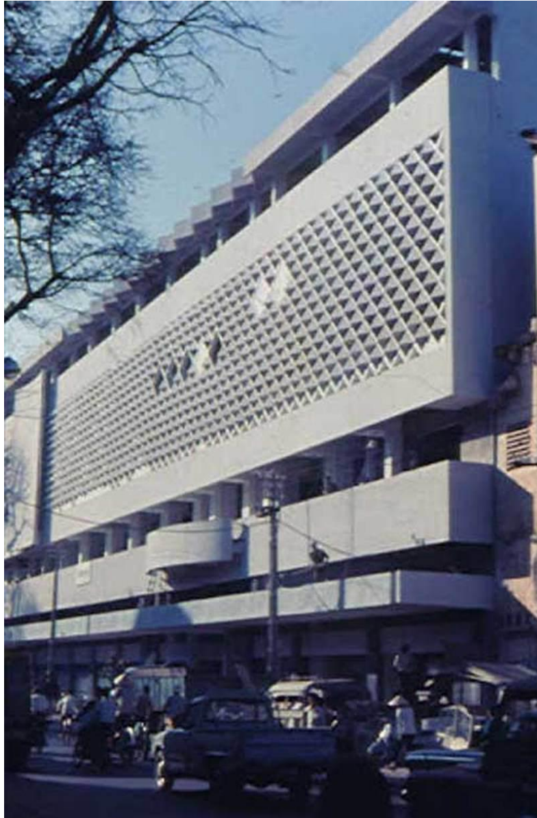
Thương xá Crystal Palace