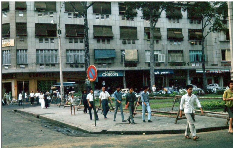
Thương xá Eden

Người ở Sài Gòn trước đây hầu như ai cũng biết 3 thương xá lớn nằm ngay trung tâm Q1, cũng có nghĩa là trung tâm Sài Gòn: thương xá Eden, góc đường Tự Do-Lê Lợi, trong Eden ngoài những quầy hàng cửa kính, bán những mặt hàng tiêu dùng sang trọng còn có rạp chiếu phim Eden, ngày đó là một trong những rạp chiếu phim sang trọng của Sài Gòn ngoài Rex, Đại Nam.