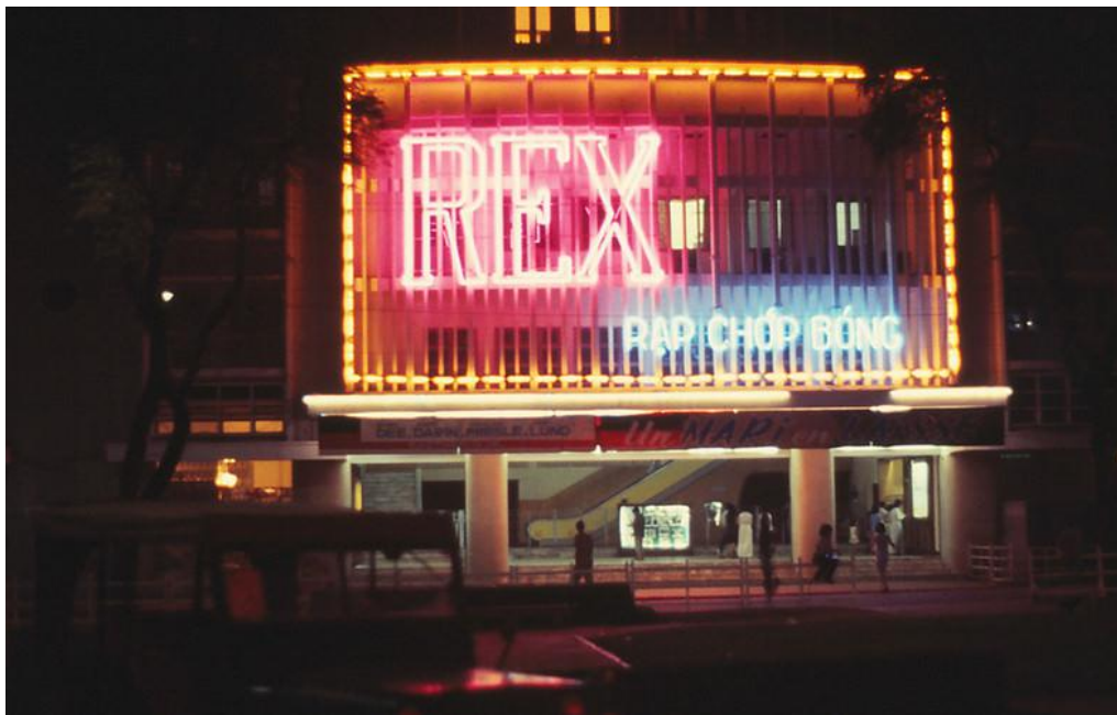
Rạp chớp bóng REX

Những bộ phim chọn lọc, nhớ đời. Bây giờ thú rong chơi, bát phố ấy đâu còn nữa, những quán cà phê, rạp chiếu phim thừa ấy cũng đã mất dấu... chỉ còn hiện ra trong hồi tưởng của người Sài Gòn hoài cổ.