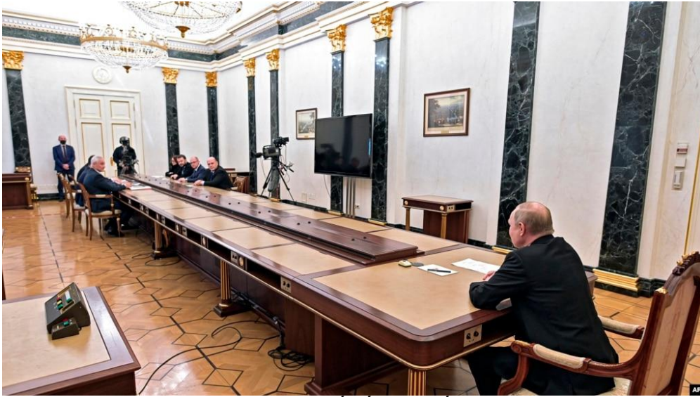
TT Putin trong một phiên họp với cố vấn kinh tế tại Moscow, 28 tháng Hai.

Khi cuộc chiến chấm dứt, Vladimir Putin sẽ hiện nguyên hình là một người hùng làm bằng giấy, hay bằng rom theo lối nói của người Việt. Sẽ đến ngày anh hùng rom phải ra tòa vì tội ác chiến tranh.