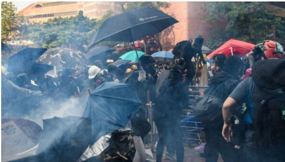
Cảnh sát Hồng Kông bắn hơi cay vào người biểu tình tại Đại học Bách khoa ngày 18/11/2019.

Ông nói rằng người dân Hồng Kông đã trải qua 5 tháng rèn giũa không ngừng nghỉ; dầu có phải đổ mồ hôi, đổ nước mắt, đổ máu ..... họ cũng phải giành lại tự do, giành lại nền pháp trị của họ, qua đó giành được sự tôn trọng của cả thế giới!