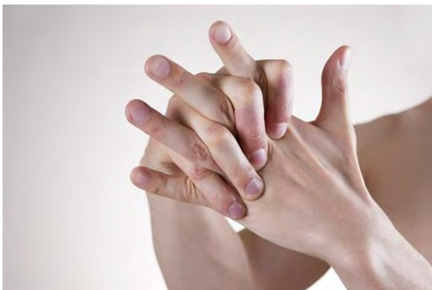
Bẻ khớp ngón tay tạo cảm giác vô cùng sáng khoái

Khi bẻ khớp, gân này được kích thích làm giảm cơ bắp chung quanh, mang đến cho bạn cảm giác được thả lỏng và dễ chịu, tiếp thêm nhiều sinh lực khi làm việc. Các khớp này có xu hướng trơn hơn trong một khoảng thời gian ngắn sau khi bạn bẻ khớp.