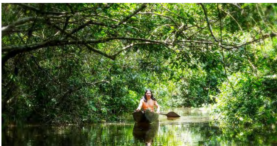
Incredibly Rare Footage Shows The Last Survivor Of Isolated Amazonian Tribe