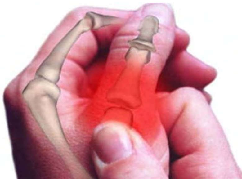
Bẻ khớp ngón tay thường xuyên làm tăng nguy cơ thoái hóa sụn khớp

Nếu bẻ khớp ngón tay trong một thời gian dài, sự cọ sát và áp lực lên mặt khớp cao hơn khiến làm hao mòn mặt khớp, nghiêm trọng hơn là nguy cơ thoái hóa và viêm mặt sụn khớp. Mỗi lần bẻ nắn khớp là một lần gây chấn thương lớn nhỏ đến khớp và kéo theo các tế bào sụn sẽ bị chấn thương luôn. Và do các chấn thương trên cùng một ổ khớp khi tích tụ nhiều, lâu dần sẽ làm hao hụt chất sụn.