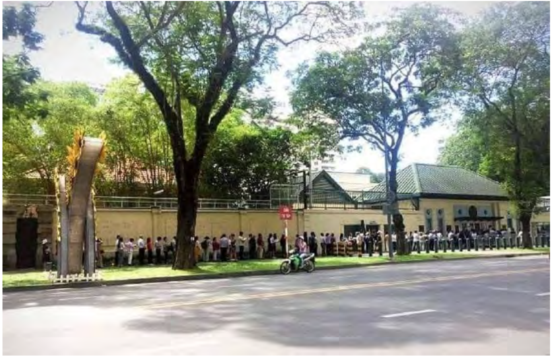
Ảnh: Hàng người dài nộ đơn xin visa Mỹ tại Thành hồ