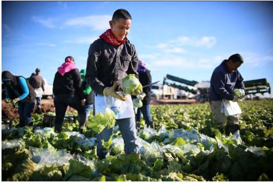
Mọi công việc tại Mỹ đều được xem trọng

Ở nhiều quốc gia Châu Á, người ta rất coi trọng "văn hóa quen biết", chẳng hạn nếu bạn có quen biết hoặc là họ hàng của một viên chức nào đó thì chắc chắn công việc của bạn sẽ được thuận lợi và nhận được sự coi trọng của người chung quanh. Nhưng ở Mỹ, điều đó chắc chắn là không xảy ra.