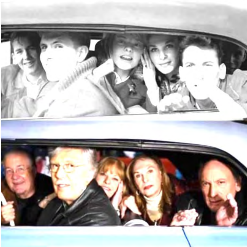
Ringo Starr snapped a photo of some high school students who had skipped class to see the Beatles during their first trip to the US. 50 years later, the group reunited and recreated the photo.