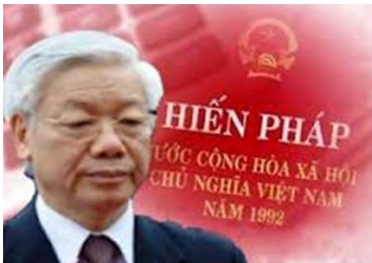
CHXHCNVN (Chẳng Hề Xấu Hồ Chút Nào Vì Ngu)

Tác phẩm “Trại súc vật” (Animal Farm) của ông, tổng cộng 112 trang, trở thành kinh điển lật mặt nạ chủ nghĩa cộng sản. Được viết từ năm 1945, dịch ra hàng trăm thứ tiếng, trong đó có cả tiếng Việt. Vì ngu dốt, chính quyền cộng sản Việt Nam đã cho xuất bản tại Sài Gòn, nhưng sau đó ra lệnh tịch thu. Năm 2008, báo The Times đã vinh danh George Orwell đứng hàng thứ hai trong 50 nhà văn Anh nổi tiếng nhất sau 1945. Hãy xem danh ngôn trong “Trại súc vật” đúng là báo động cho những ai chưa ném mùi cộng sản.