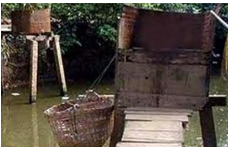
"xây nhà cầu" (xây dựng nước nhà và cầu nguyện) vậy.

Anh nói dối vì sợ em lo và buồn, không ngờ đã khiến em khóc vì tủi thân với giỏ quà khiêm tốn! Đói ta học nói dối từ bao giờ vậy? Sẽ có một ngày, anh phải xưng tội với em, nếu không Chúa sẽ đưa anh vào địa ngục.