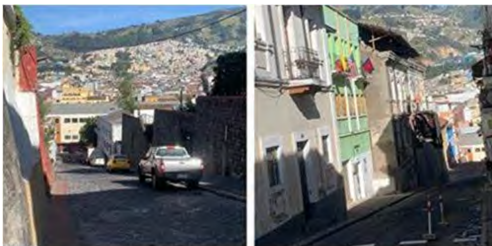
Một khu dân cư ở Quito, thủ đô của Ecuador.

Vợ của anh Tôn lâm bệnh ở Quito. Họ lập tức đến bệnh viện, nhưng bác sĩ ở đó đã không thu tiền khám bệnh, chỉ kê đơn để họ ra ngoài tự mua thuốc. Anh Tôn đã rất cảm kích trước hành động này.