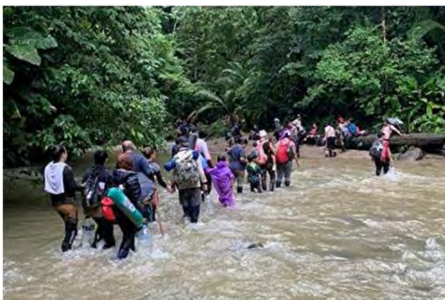
Những người di cư lội qua một con sông trong rừng rậm Panama.

Năm ngày sau, họ ra khỏi khu rừng này. Bàn chân và bắp chân của anh Tôn chẳng chịt những vết thương và bầm tím.