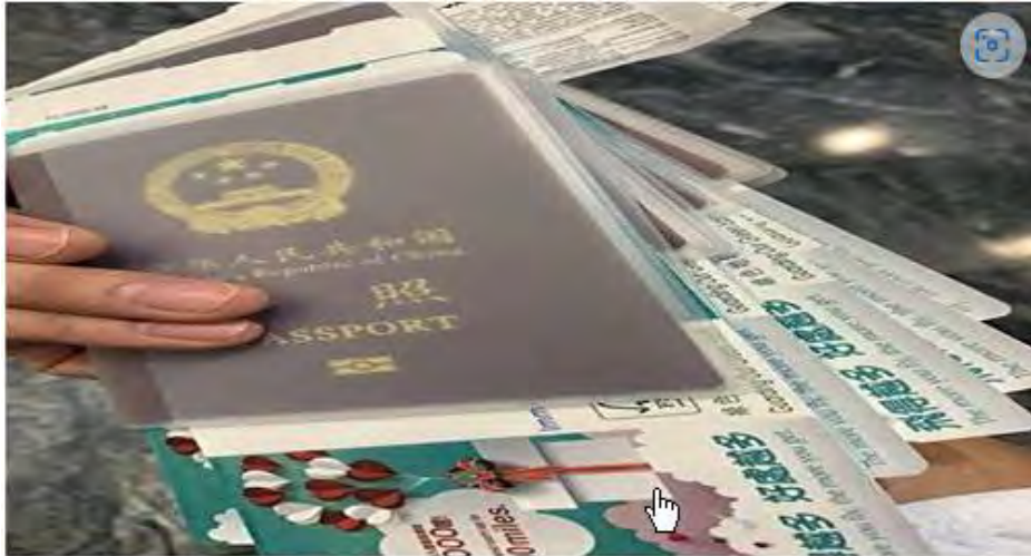
Hộ chiếu và vé phi cơ của anh Tôn và gia đình đã từng rời Trung cộng hồi tháng 08/2022.

Họ không biết điều gì đang chờ đợi mình phía trước, chỉ biết rằng cả nhà họ đều quyết tâm theo đuổi tự do bằng bất cứ giá nào. Anh Tôn và vợ nghỉ việc, sau đó ra đi mà không nói lời tạm biệt với bất kỳ ai, kể cả cha mẹ hai bên, vì họ không muốn cha mẹ can dự vào kế hoạch của họ hay lo lắng cho họ.