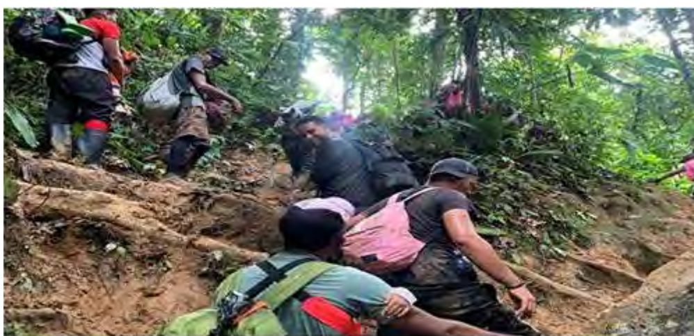
Những người di cư đi bộ xuyên qua khu rừng nhiệt đới ở Panama hồi tháng 10/2022.

Trải qua ba tháng trời rông rã trên chặng đường tìm kiếm tự do, băng qua mười quốc gia, trong đó có tám quốc gia ở Nam Mỹ, cuối cùng thì gia đình của một chàng trai trẻ người Trung cộng cũng đã đặt chân đến được mảnh đất Hoa Kỳ.