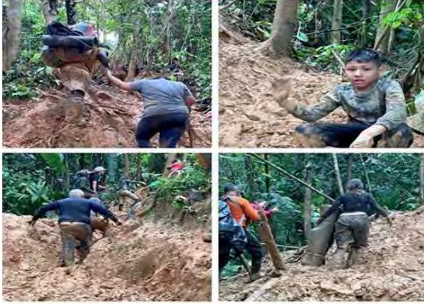
Người di cư băng qua khu rừng rậm ở Panama.

“Hãy nhìn xem, những người Nam Mỹ đang đi bộ cùng con của họ,” anh Tôn nói trong một đoạn video mà anh đã quay những người bạn đồng hành của mình. Anh đã đăng tải đoạn phim này lên tài khoản Twitter của mình và nói thêm rằng, “Không gì có thể ngăn cản khát vọng tự do của chúng ta.”