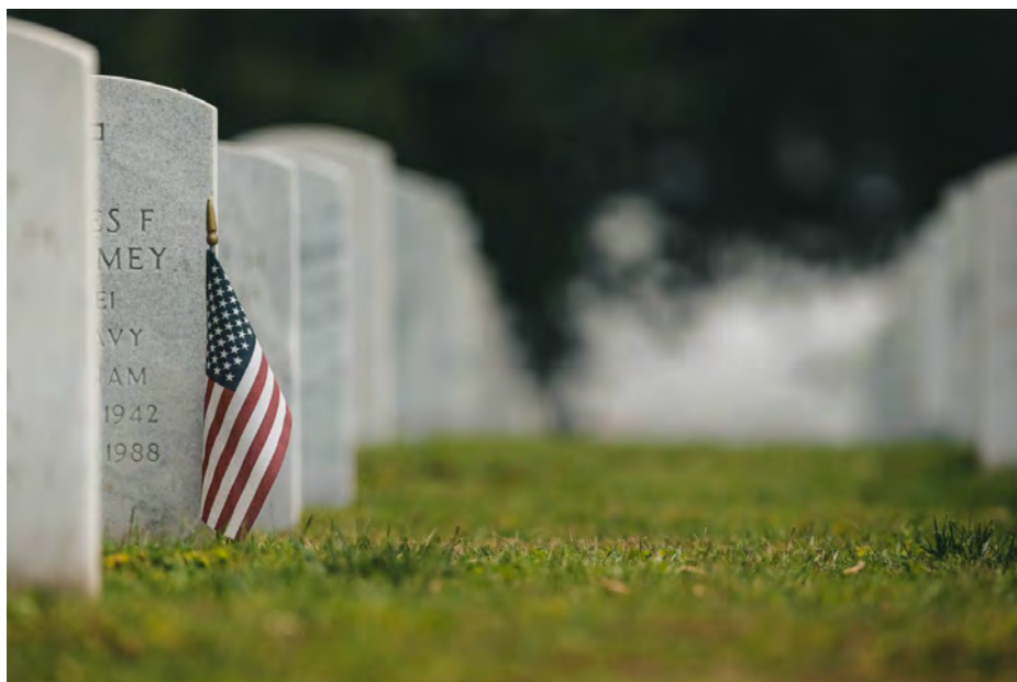
Minh họa: chad-madden-unsplash