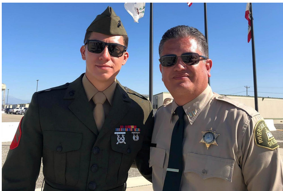
Hình chụp Hunter Lopez và một nhân viên cảnh sát quận hạt Riverside

Để tưởng thưởng công trạng giúp đỡ, Hunter Biden đã nhận được một thẻ tín dụng 100,000 USD từ Jianming.