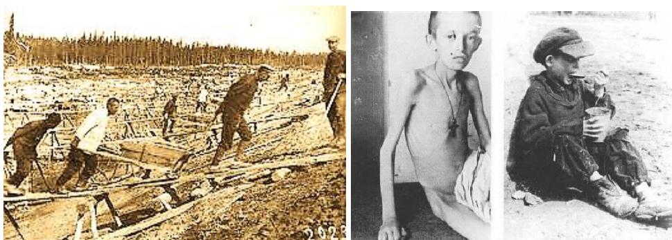
Trại lao động khổ sai Gulag

Hai năm 1936, 1937 là thời gian kinh hoàng nhất đã bao trùm trên Liên Xô, gọi là “Nỗi khiếp sợ vĩ đại”.