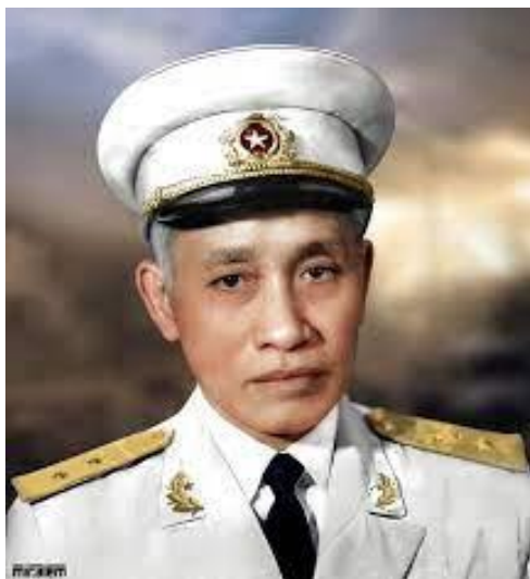
Lê Trọng Tấn

4.4.). Những tướng lĩnh thân cận với Võ Nguyên Giáp bị thanh toán