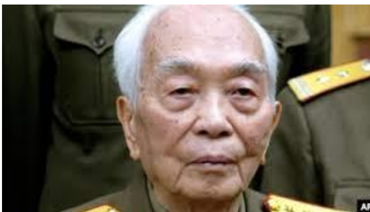
Hồ Chí Minh và Võ Nguyên Giáp