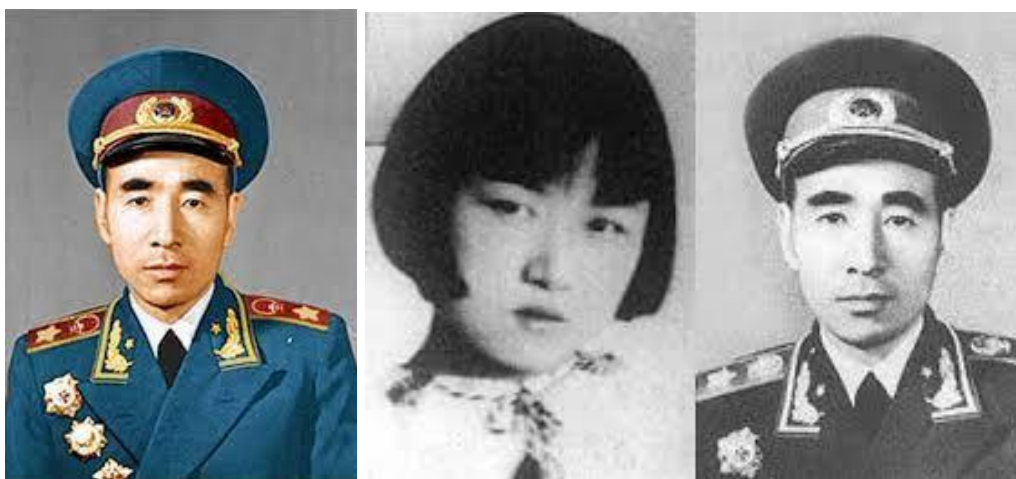
Lâm Bưu và vợ

Lâm Bưu là thuộc cấp của Bành Đức Hoài, lừa thầy phản bạn, được Mao cho Lâm Bưu thay thế BÐH ở chức vụ Bộ trưởng Quốc Phòng, rồi làm Phó chủ tịch đảng, là nhân vật số hai, và được chọn làm người kế vị Mao. Lâm Bưu là “Kiến trúc sư” của cuộc Cách mạng Văn hoá.