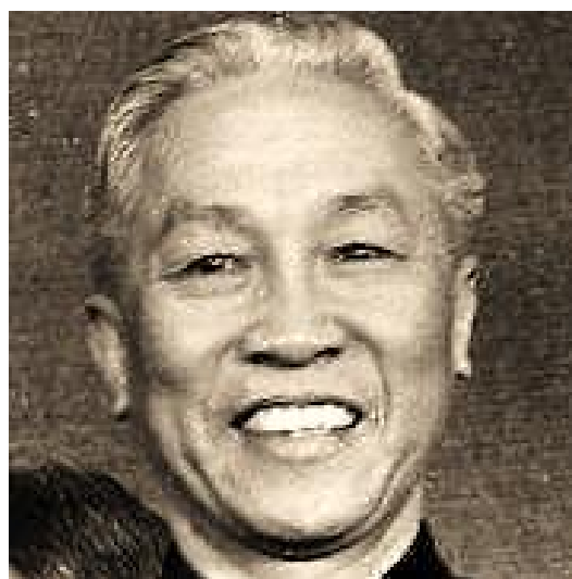
Lê Đức Thọ

Âm mưu tước đoạt quyền lực của Hồ Chí Minh. Theo một tài liệu được tiết lộ hồi sau năm 1975, thì Lê Duẩn và Lê Đức Thọ âm mưu tước đoạt quyền lực của Hồ Chí Minh bằng con đường đầu độc, thông qua các bác sĩ trị liệu, rồi căn cứ vào đó gán cho ông Hồ chết vì bệnh nhồi máu cơ tim. Ông Hồ không chết, bệnh nặng nên được đưa sang Trung Quốc chữa trị.