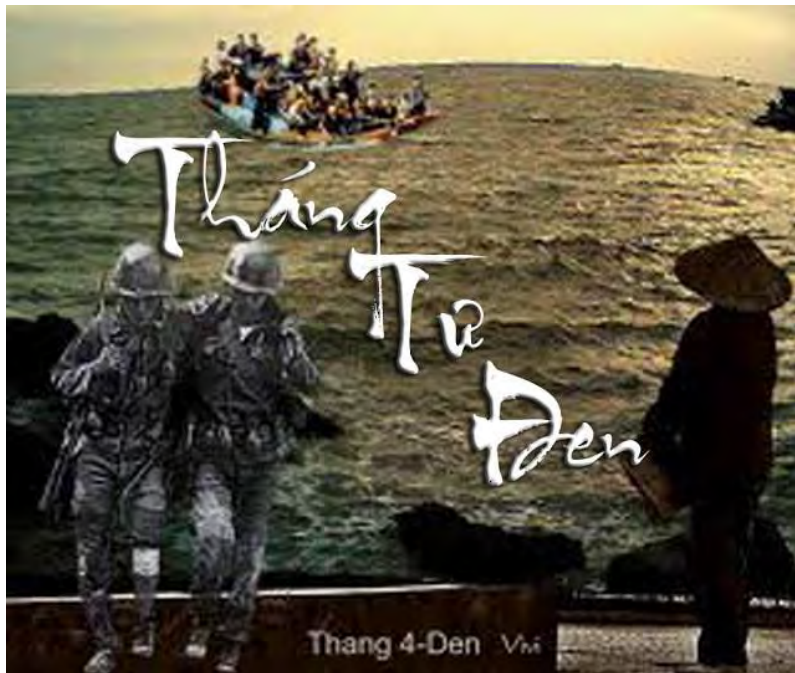
Gió Đưa Cây Cãi Về Trời Rau Răm Ở Lại, Chịu Đờn Đắng Cay !