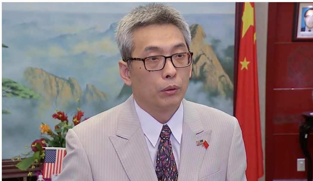
Tổng lãnh sự Trung Quốc tại thành phố Houston Thái Vĩ trả lời phỏng vấn hôm 22/7.

Rubio hiện đang là chủ tịch của Ủy ban Tình báo Thượng viện, và giống như các nhà lãnh đạo của “nhóm 8 thành viên” của Quốc hội, ông có quyền truy cập vào thông tin tuyệt mật của Quốc hội. Ông Rubio cũng là thành viên cao cấp của Ủy ban Đối ngoại Thượng viện và Chủ tịch Quốc hội và Ủy ban Điều hành về các vấn đề Trung Quốc, ông đặc biệt chú ý đến các chính sách của ĐCSTQ và Nga.