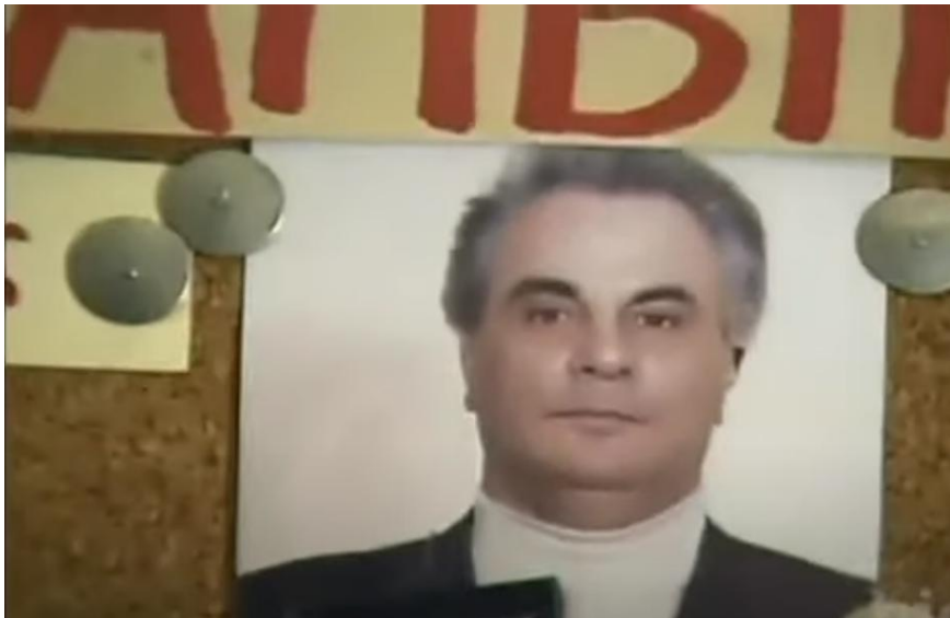
Mafia Boss Gambino

Mới đây tôi xem một bộ phim tài liệu về chính phủ Hoa Kỳ cuối cùng đã dẹp được bọn cướp (hay còn gọi là Mafia). Trong nhiều thập kỷ, chính phủ Hoa Kỳ đã thất bại thảm hại. Tại sao? Bởi vì họ chỉ có thể bắt những "tên lính" cấp thấp trong nhóm tội phạm chứ không bao giờ bắt được ông trùm mafia cả (mà họ gọi ông là The Don).