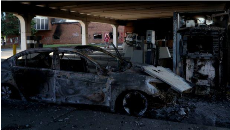
Một chiếc xe bị đốt cháy ở thành phố Minneapolis

Hàng trăm binh sĩ từ Lực lượng Vệ binh Quốc gia, một lực lượng quân sự dự bị có thể được tổng thống Mỹ hoặc thống đốc các tiểu bang kêu gọi can thiệp vào các tình huống khẩn cấp trong nước, đã chuyển đến vào đêm khuya.