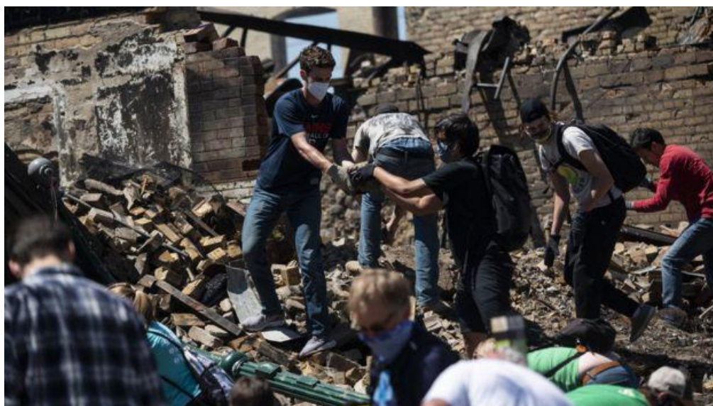
Dân Minneapolis hôm thứ Bảy xúm nhau giúp dọn dẹp đống đổ nát của các tòa nhà bị đốt cháy và bị cướp phá ở thành phố này

Ông và các quan chức khác nói rằng có nhiều người biểu tình bạo động đến từ bên ngoài tiểu bang để gây rắc rối, nhưng không cho biết chi tiết.