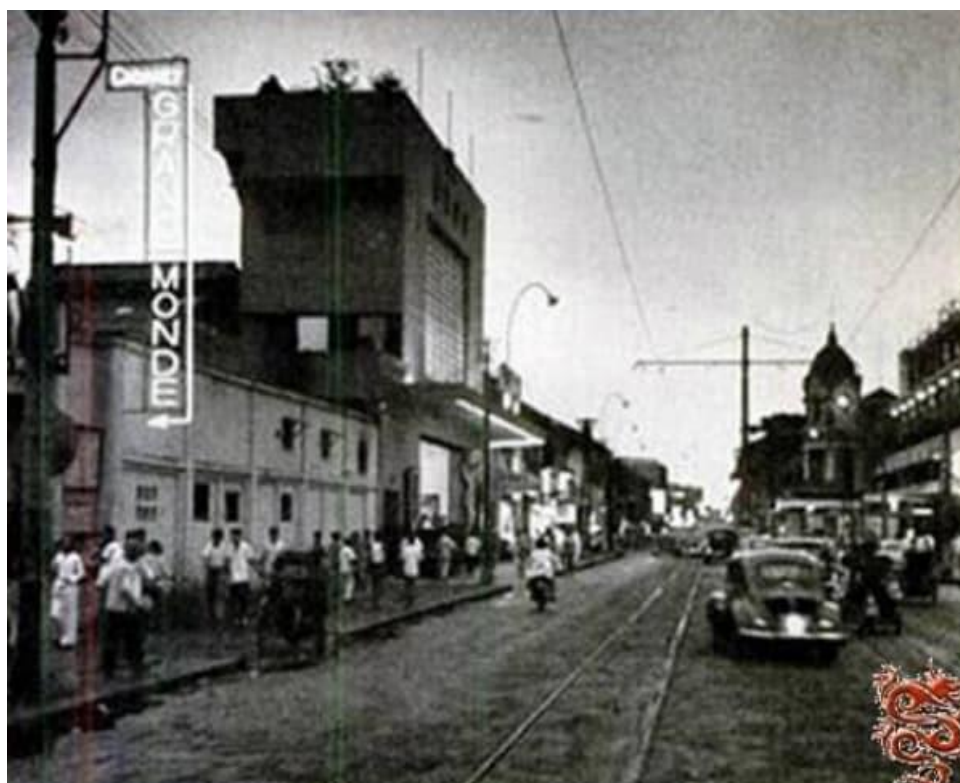
Tám biển Casino Grande Monde – Sông bạc Đại Thế Giới.

Nơi tôi đến đầu tiên là Chợ Lớn. Một cuộc taxi từ giữa trung tâm thành phố đến cuối Chợ Lớn mất 12 đồng. Tôi tìm đến khách sạn rẻ tiền của mấy thằng bạn Bắc Kỳ ở đường Tân Đà, một con phố nhỏ. Ba bốn thằng thuê chung một phòng cũng chẳng có “ông mã tà” nào hỏi đến. Chợ Lớn hồi đó tấp nập hơn ở Sài Gòn, con phố Đồng Khánh chi chít những khách sạn, hàng ăn, cửa tiệm tạp hóa lu bù tưởng như mua gì cũng có.