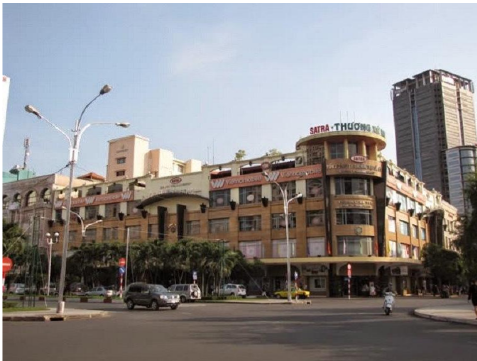
Thương xá Tax.

Đèn đuốc vẫn thấp sáng choang, chiếc thang máy cuốn vẫn lặng lẽ chạy không một bóng người. Nó mang một vẻ gì như người ta vẫn lặng lẽ theo sau một đám tang. Trong quây hàng đầu tiên, điều khiến tôi chú ý là hàng chữ nổi bật hàng đại hạ giá (Big Sale) tới 70% đỏ loét chạy dài theo quây hàng và hàng chữ “Tạm biệt thương xá Tax”.