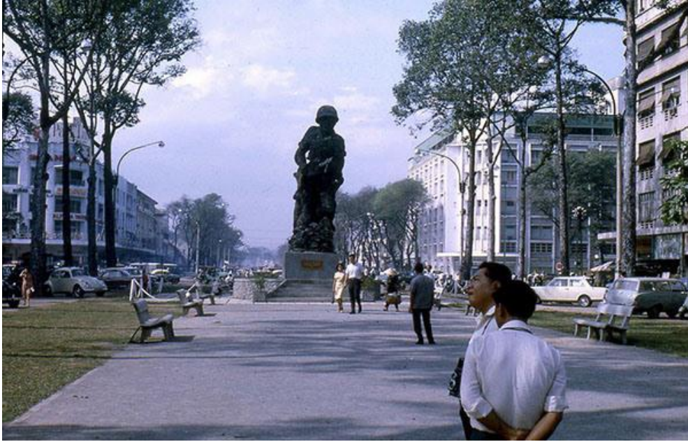
Pho tượng Thuý Quân Lục Chiến.

Chắc hẳn bạn còn nhớ ngay cạnh đó là góc bùng binh Nguyễn Huệ – Lê Lợi còn là nơi tổ chức đường hoa vào dịp Tết. Gia đình nào chẳng một lần kéo nhau đi giữa đường hoa với tâm trạng rộn ràng của một ngày hội hoa xuân. Từ năm nay sẽ mất hẳn, chẳng bao giờ thấy bóng dáng mùa xuân ở đây nữa.