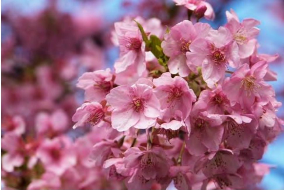
Kawazuzakura tại lễ hội hoa anh đào Kawazu.

Kawazuzakura là loại hoa anh đào nở sớm nhất Nhật Bản. Bạn có thể tìm thấy một lượng lớn loại hoa này tại một thị trấn mang tên Kawazu thuộc địa phận tỉnh Izu.