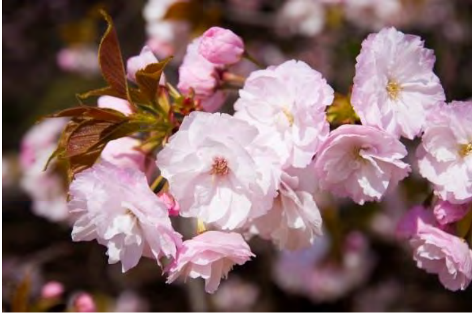
Ichijo Sakura!

Ichijo là một loại hoa anh đào phổ biến thường nở vào giữa tháng 4, đặc biệt ở vùng Kanto. Đây là một loại hoa anh đào nở muộn với số lượng cánh nhiều hơn 5.