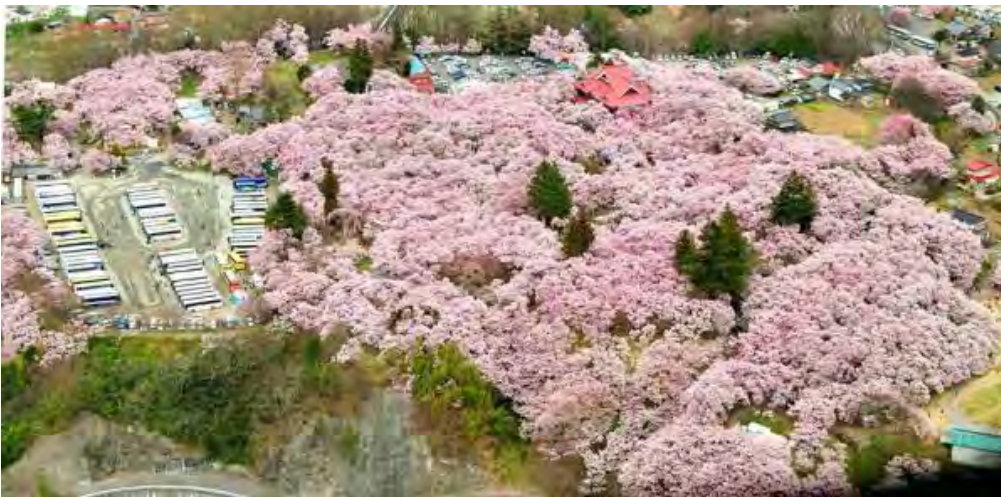
Đây là khung cảnh công viên nhìn từ lâu đài Katako!

Takao Khigan Sakura có 5 cánh mang sắc hồng phớt đỏ nhẹ nhàng. Và cũng như các bạn thấy, cũng vì đây là loại hoa anh đào đặc biệt, bạn có thể thấy rất ít cành của loại cây này từ phía xa.