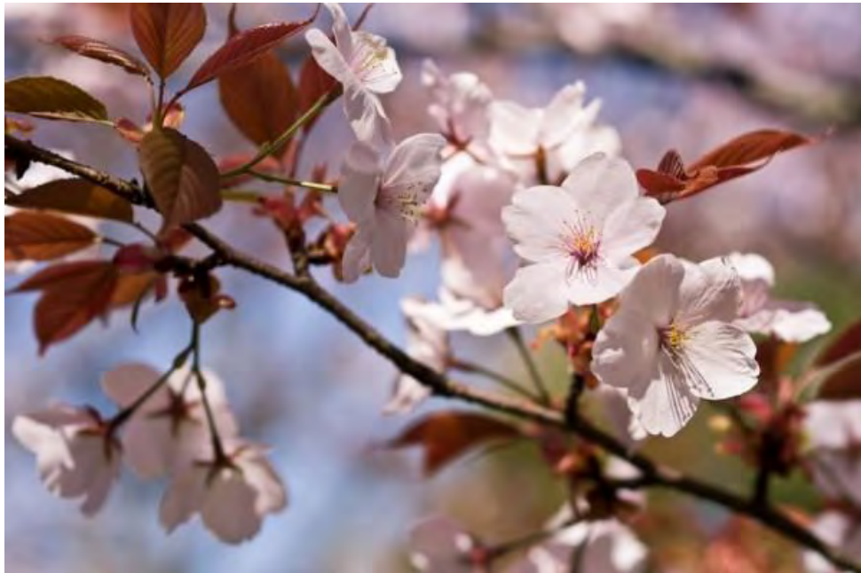
Yamazakura và những chiếc lá đỏ thẫm xen kẽ.

Yamazakura là một loại hoa anh đào núi, được xếp vào một trong những loài anh đào hoang dã nhất Nhật Bản. Nếu bạn có cơ hội đến Yoshinoyama trong suốt mùa xuân chắc hẳn bạn sẽ phải trầm trồ trước vẻ đẹp mà Yamazakura đem lại cho nơi này.