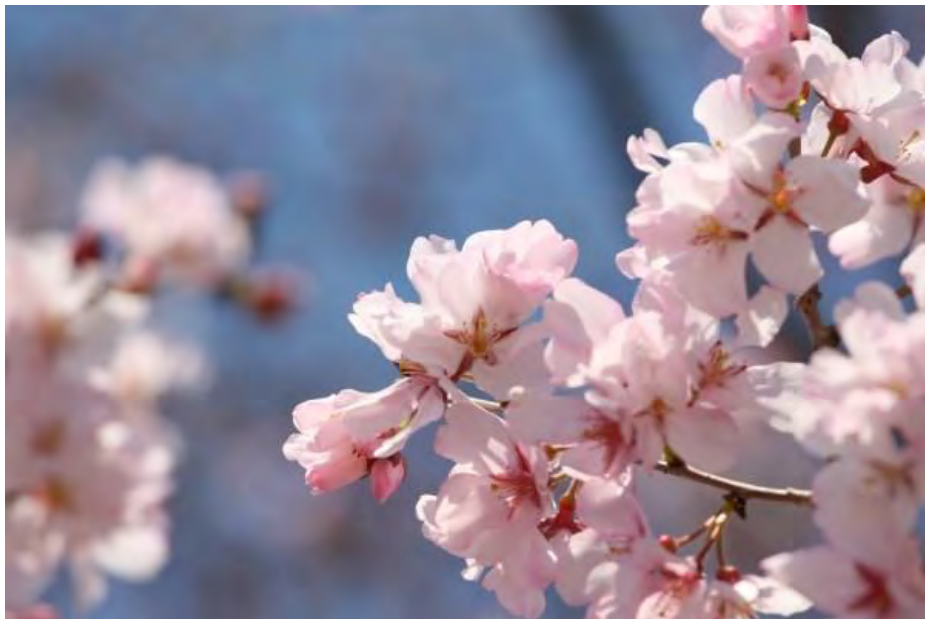
Loài hoa Edohigan Zakura.