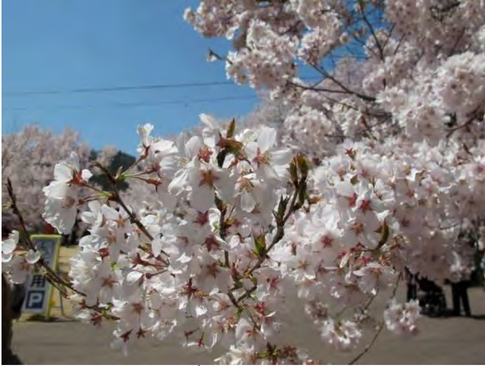
Takao Khigan Sakura, Nagano.

Loại hoa anh đào này chỉ được tìm thấy trên công viên thuộc lâu đài Takato, tỉnh Nagano. Đây là một loại hoa anh đào đặc biệt nở vào đầu tháng 4.