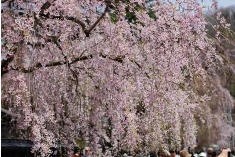
Shidarezakura tại quận Kakunodate samurai, Akita.

Shidarezakura là loại hoa sakura mà tôi luôn yêu thích. Nếu bạn cũng yêu mến loài hoa này, hãy đến với quận samurai Kakunodate, nơi này có cả một hàng những cây Shidarezakura được trồng ven đường.