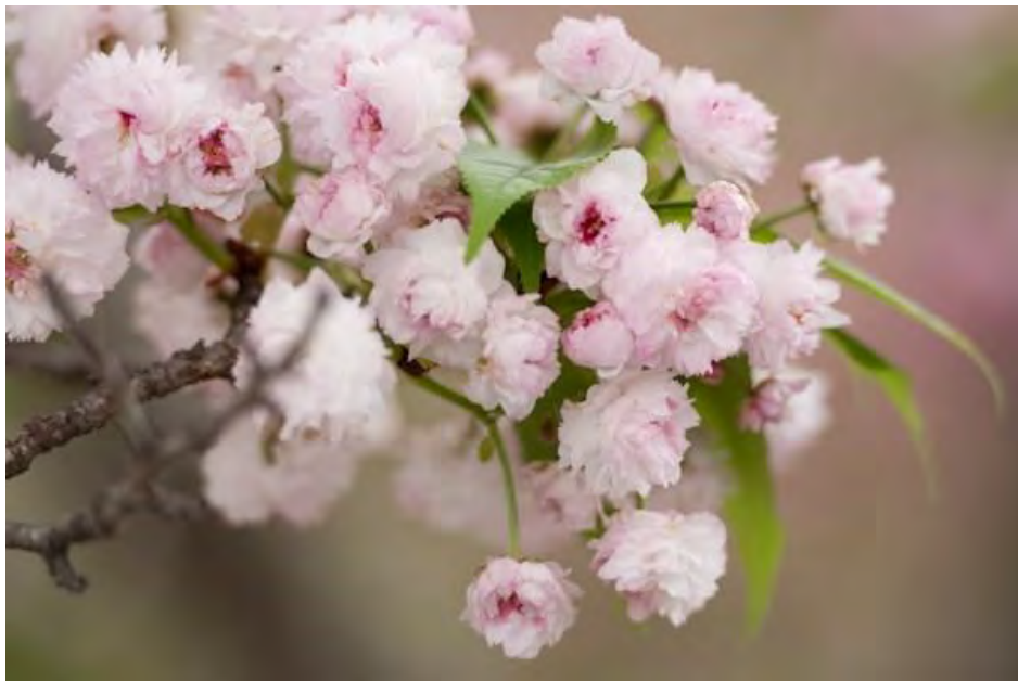
Kikuzakura, Japan.

Mệnh danh là loài hoa sakura trăm cánh, đây là loài sakura nở muộn phổ biến tại Nhật. Đối với loại sakura này, hoa và lá thường xuất hiện cùng lúc.