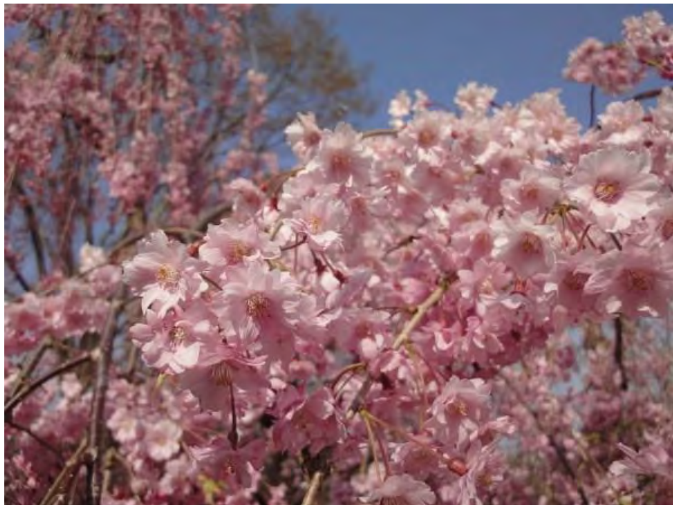
Yaeshidarezakura – Hoa anh đào nhiều cánh với cánh ngả dài quỳn rũ.

Có rất nhiều cây hoa Shidarezakura ở Tohoku như Miharu Takizakura khổng lồ, tọa lạc tại tỉnh Fukushima. Được biết, cây hoa anh đào này đã tồn tại hơn 1000 năm.