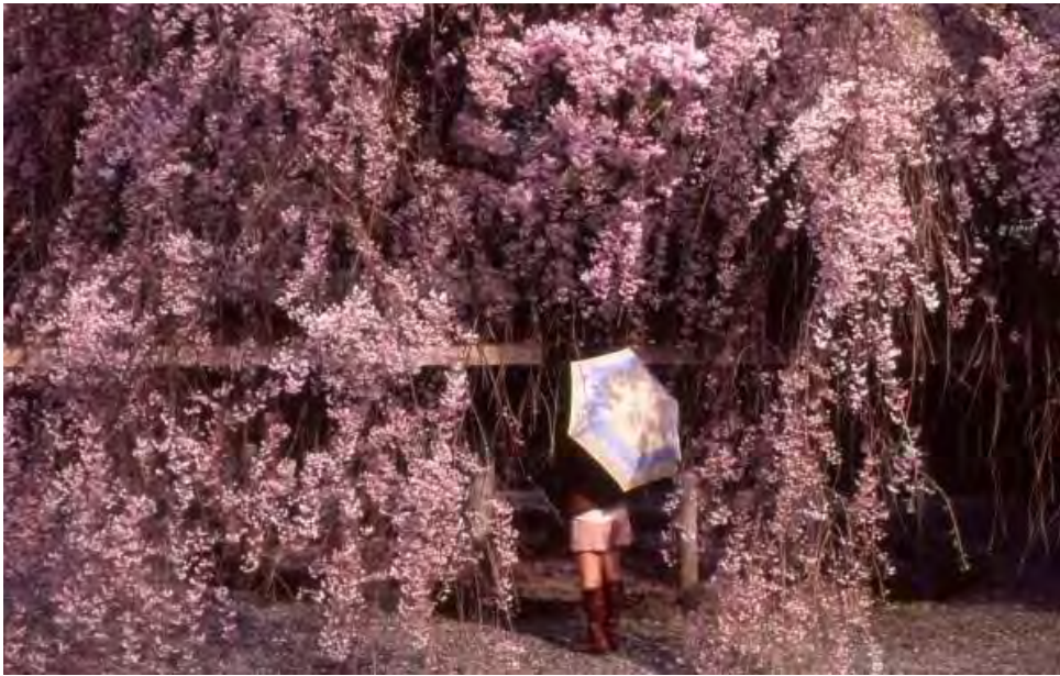
Bạn có thể cho tôi biết đây là loại hoa Sakura gì không? Sakura tại đền Gotokuji, Setagaya, Tokyo.

húng ta có thể phân biệt chúng dựa vào số lượng cánh hoa, hình dáng, màu sắc cũng như thời gian hoa nở. Nếu bạn là người yêu hoa anh đào nhưng lại không biết nhiều về những loại hoa anh đào khác nhau, bài viết này có thể hữu ích cho bạn đấy.