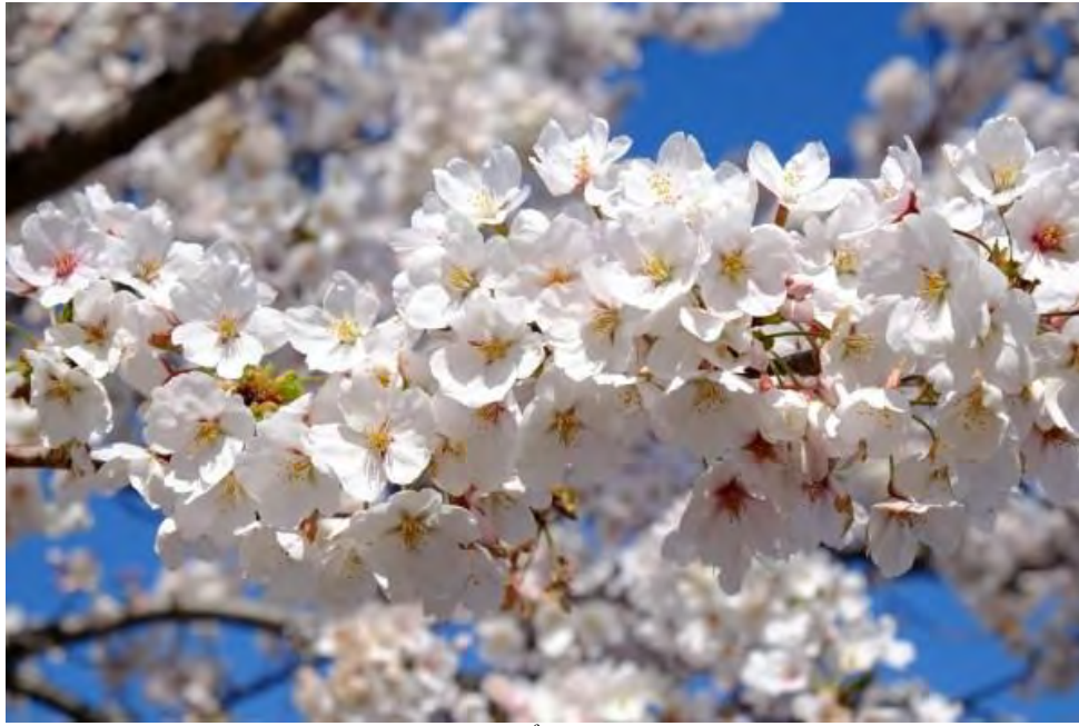
Cây hoa anh đào Yoshino.

Có hơn 100 loại hoa anh đào có thể tìm thấy ở Nhật Bản, bao gồm cả những loại anh đào mọc hoang dã. Loài hoa anh đào Yoshino này được cho là loại phổ biến nhất.