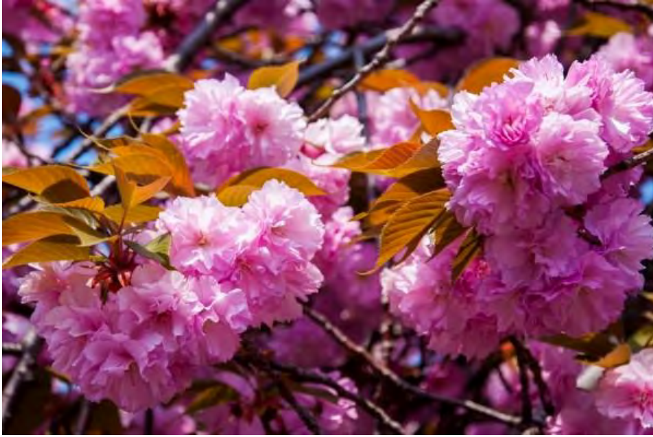
Hoa anh đào Kanzan.

Đây là loài hoa thuộc dòng yaezakura – dòng hoa sakura nhiều cánh. Thời kì mãn khai của loài hoa này thường vào cuối tháng 4. Có khoảng 30-50 cánh hoa màu hồng đậm trên nền lá nâu. Thông thường, lá non sẽ bắt đầu có trước khi hoa tàn.